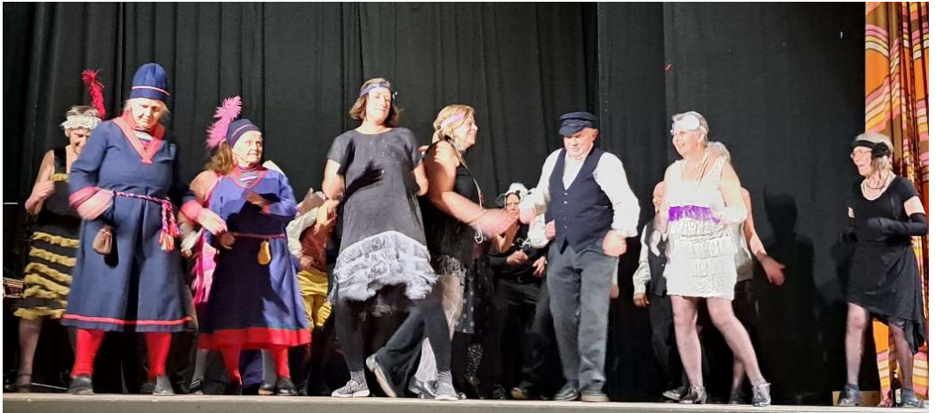
Hela ensemblen i en avslutande Twist