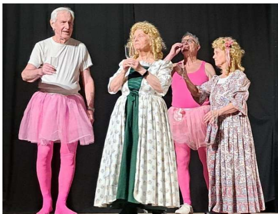
1700-talsdamer skrider in på scenen och bjuder balett- pojarna på bubbel till melodin Gustavs Skål