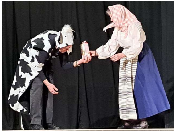
Kossan och fäbodjättan