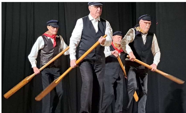
... och åror.