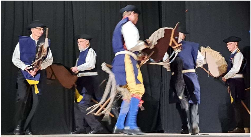
Karolinerna stormar in