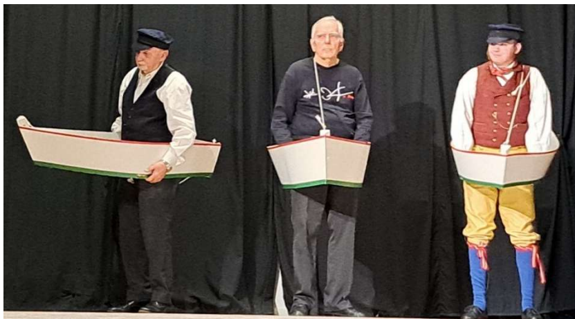
Pausnummer: Båtar ...