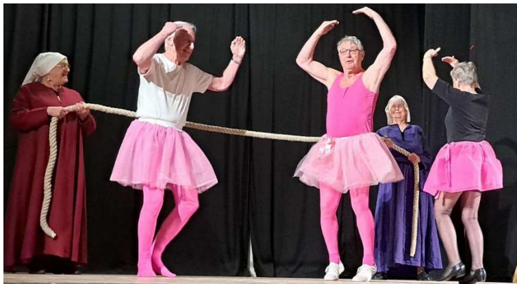
Balettpojkar med balettrep ...