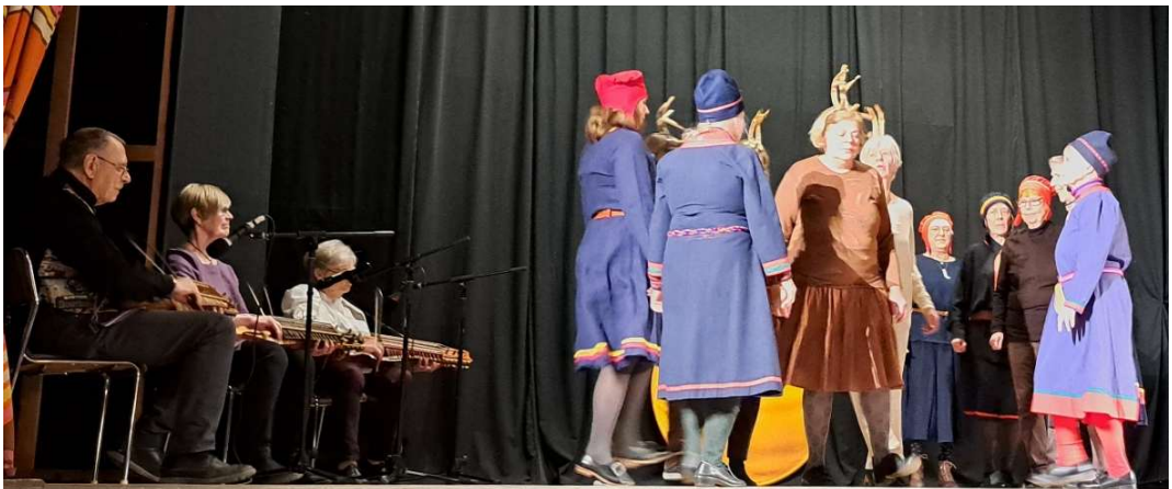
Renar och samer stormar in och dansar omkring