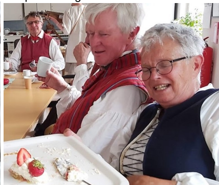
Lystna blickar på de sista jordgubbarna