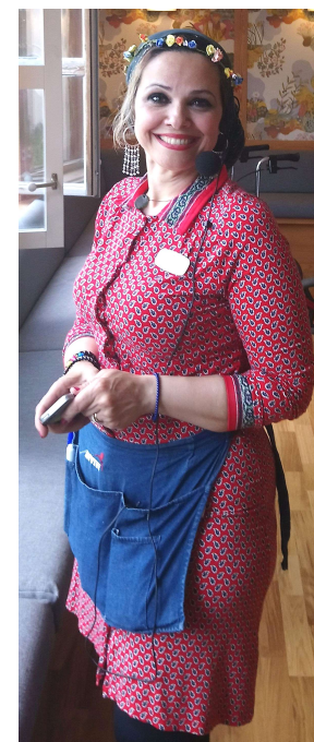
En åskådare med folkdräkt och en engagerad organisatör