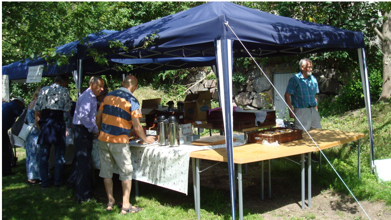
Kaffeserveringen räddad och förankrad