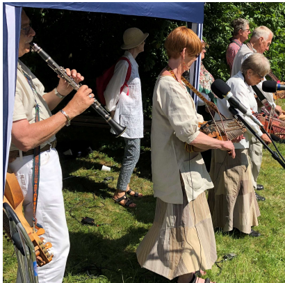
Trätakt med klarinett