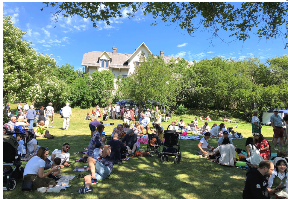
Fika på ängen nedanför den tidigare prästbostaden