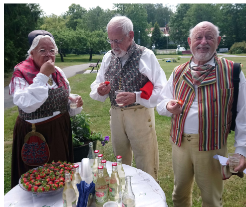
Alltid chokladdoppade jordgubbar efter dansen