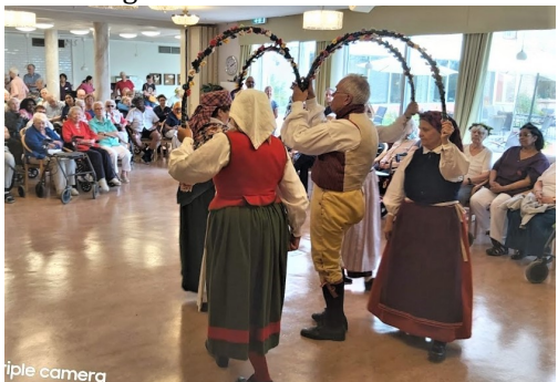
Bågdansen på inomhusgolvet

Som seden bjuder på Skoga bjöds vi på äkta jordgubbstårta med vispgräddde i personalrummet. När vi tackade för oss hälsades vi välkomna tillbaka nästa år. Vi kommer gärna!