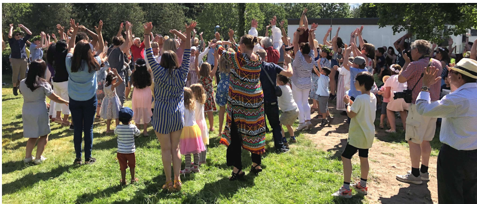
Alla sträckte sig så mycket de kunde i "Hej tummen upp"