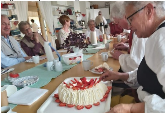
Jordgubbstårta i fikarummet.