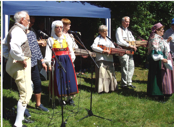
Sång och musik till ringlekarna