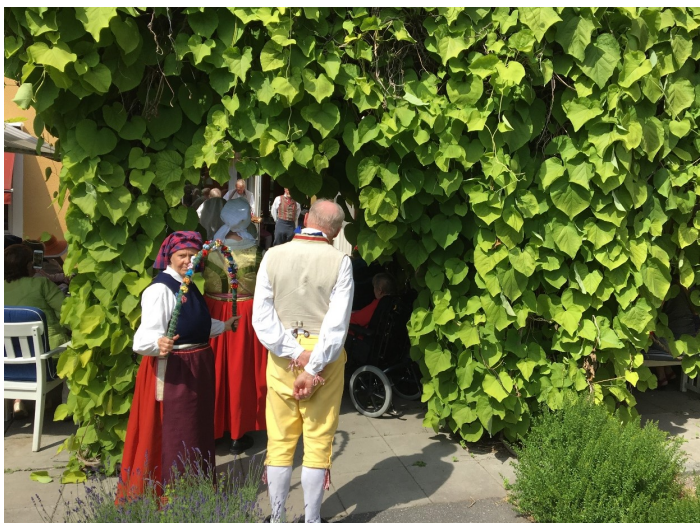
Någonstans därinne ska vi dansa

Det är vårt sjätte besök på Norrgården och vi får säkert komma tillbaka nästa år.