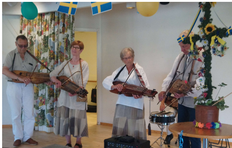
Och Trätakt givetvis