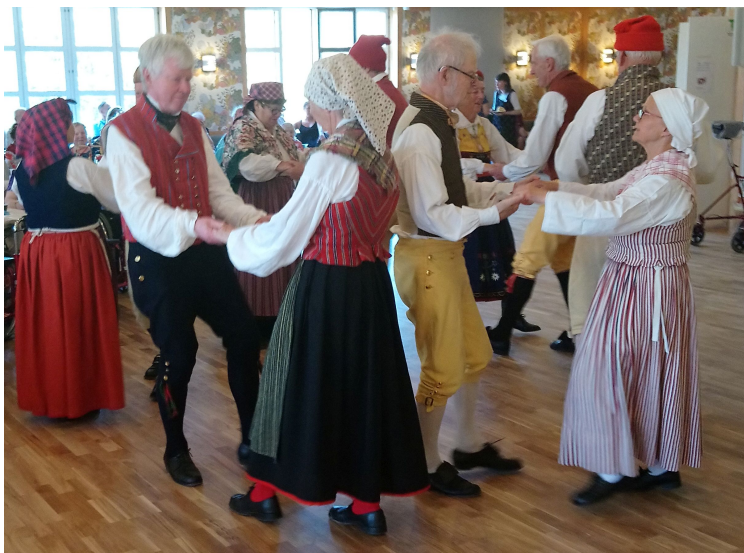
Gustavs skål går som en dans på det nylagda golvet

Kaffe med tårta avnjöts efter väl förrättat värv.