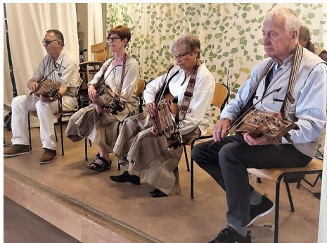
Trätakt på en riktig scen