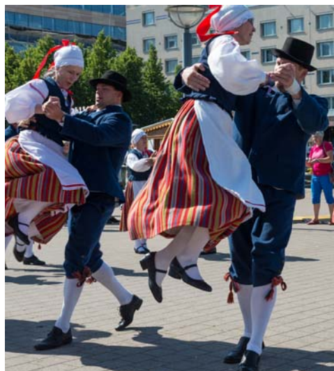
Ett estniskt lag i Stadsparken