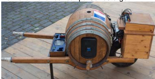
Portabel ljudanläggning från Bretagne