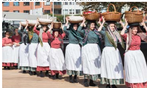
Damer i portugisiskt danslag med korgar

Skånedansarnas långdans var extra spännande för mig, som har skånsk folkdräkt, men det kändes nästan som alla 300 deltagarna hade olika dräkter. Dansen gick förbi Mariakyrkan och Kullagatan, som är en populär gågata. Målet var huvudscenen, Dunkers Plats. Den ligger intill kulturhuset. Sedan bröt dansglädjen loss och under tre timmar underhöll 17 grupper oss. Man kunde se det hela på storskärm också, vilket var