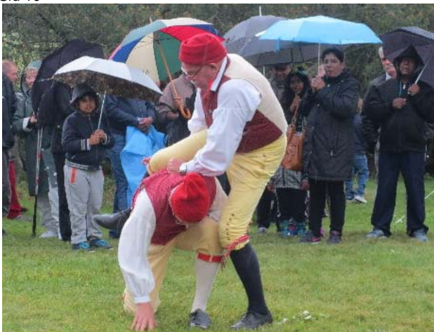
Skobodansen i regn