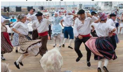
Laget från Bretagne dansar