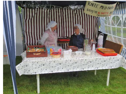
Beredda att sälja kaffe med bröd