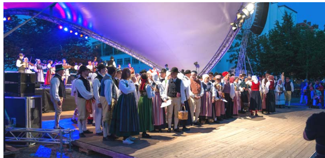
Utomhusscenen framåt aftonen

Vi var tvungna att lämna festivalen efter halva fredagen och missade den stora tretimmars paraderna genom centrala stan. Men Hesselby folkfestival väntade hemma.