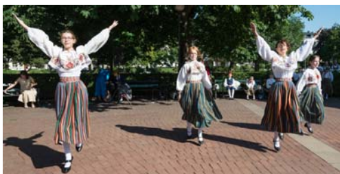
Estniska flickor dansar på Sundstorget

Vi kom till Helsingborg innan allt hade dragit igång för att konstatera att min barnomsstad inte var sig lik. Så här på sommaren dominerar det kontinentala inslaget med palmer vajande längs hela hamnpromenaden, som kändes mycket längre nu dessutom. En av scenerna som användes låg med hamnutsikt precis bakom Dunkers berömda kulturhus. Lyckliga båtägare hade första parkett. Sedan kunde man cirkulera runt till de olika torgen, parkerna och kyrkorna, större är inte staden, och följa alla dessa fantastiska uppvisningar. De enda platserna som krävde buss var Sofiero och Fredriksdal. Vi halkade för övrigt in på Fredriksdalsteatern oplanerat och såg Eva Rydbergs sommar-teater. Det enda regn vi fick på oss under festivaldagarna var ett åskregn, som dränkte oss under andra akten på friluftsteatern.