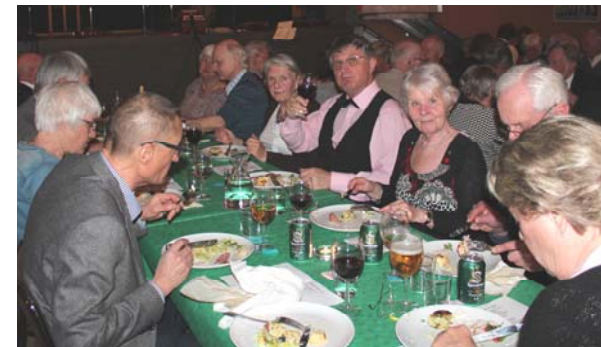
Glada miner vid bordet