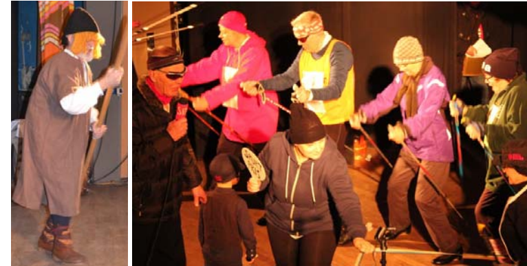
Gustaf Vasa och Wasaloppet

Dalarna får man naturligtvis inte missa på en sådan här resa. Ett stort nummer gjordes om Gustav Vasa och Vasaloppet. Det var skidåkare med skoskav, blåbärs-soppa, TV-reportage och allt som hör vasaloppet till.