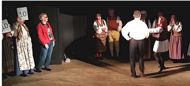
Delsbostintan i kort-kort fick högsta poängen

Hälsingehambon och Hårgalåten med Hambostinta i kortkort väckte speciella nostalgiska känslor hos oss. Vi har dansat Hälsingehambo många gånger och vi känner också hambostintan som klippte av sin kjol och fick