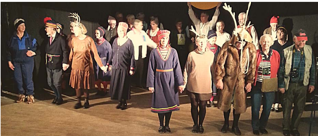
Sameflickor, renar, rentjur, samepojke och midnattssol