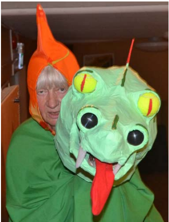
Det förfärliga Storsjödjuret skrämde publiken