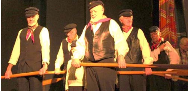
Postroddare på Ålandshav

Resan gick vidare till Södermanland och Uppland med vår vackra huvudstad och dess skärgård.