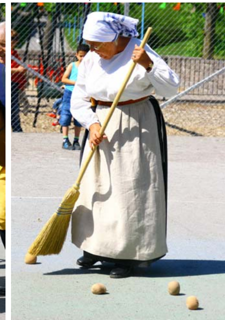
lämnade spillning efter sig!