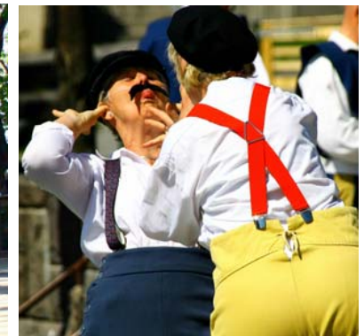
Philoccoros med utklädda damer