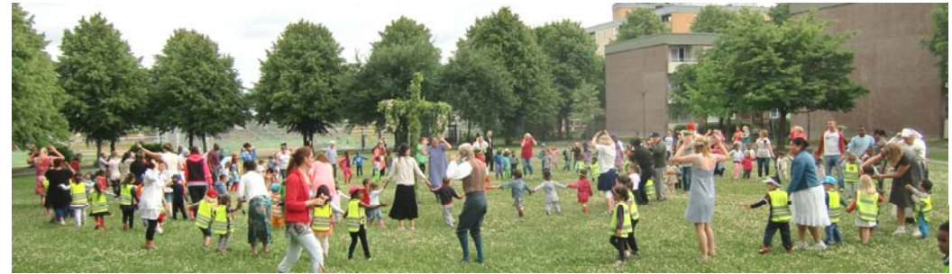
Ej öron, ej öron på Tenstaängen