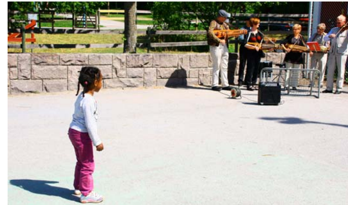
En flicka beundrar Trätakt