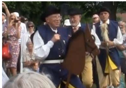
Bland allt folket skimtar några karoliner till häst Trätakt stod som vanligt för musiken