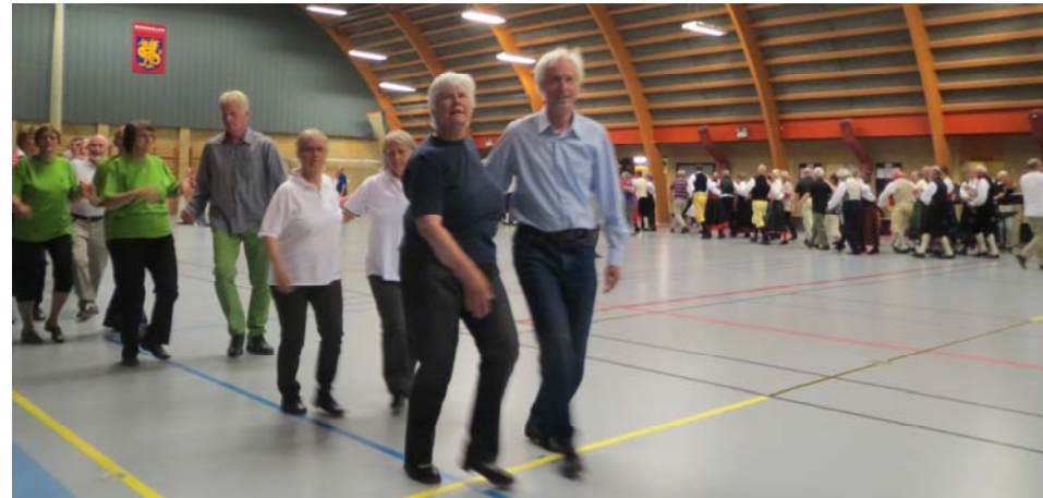
Intåg i den stora idrottshallen för att träna "faellesdanser"