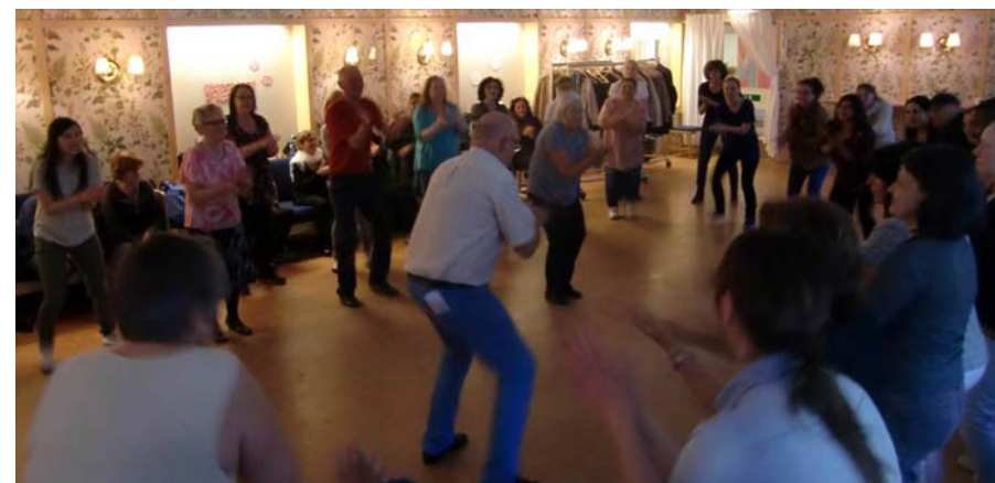
Ove startar raketten