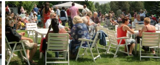
... de sittande gästerna