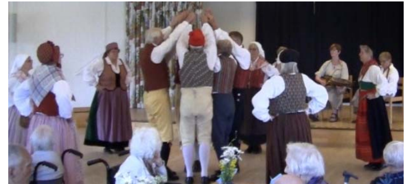
Midsommarhambo, skärmsklipp från film

Vi trivs sååå bra på Fristads fina golv, som gjort för dans i den ljusa lokalen, med även en praktisk scen för Trätakt. De medeltida danserna Saltarello och Vittrad inledde årets midsommarprogram. Sedan var planen att avsluta med Turingehambo, men så blev det inte alls. Det blev allmän dans istället, eftersom flera i publiken gärna lät sig bjudas upp till både vals och schottis. Vid kaffet uppmanades vi att sprida oss bland publiken, vilket ledde till att givande samtal utspann sig om dansminnen från ett långt liv, men även om gemensamma bekanta som t ex gymnastiklärarinnor som satte pli på lata elever under förra seklet. Trevligt var det och som vanligt bjöds vi på härlig jordgubbstårta.