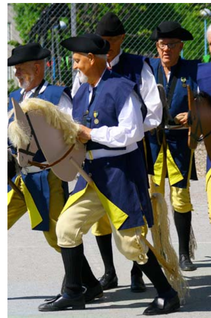
Karolinernas hästar ...