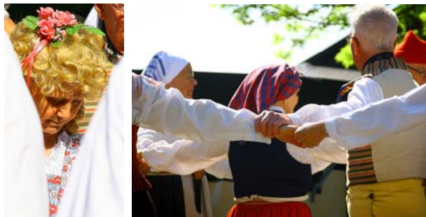
Peruk mellan breda axlar och sammanhållning