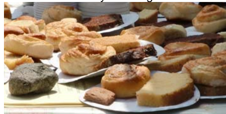
Mycket bröd gick åt till ...