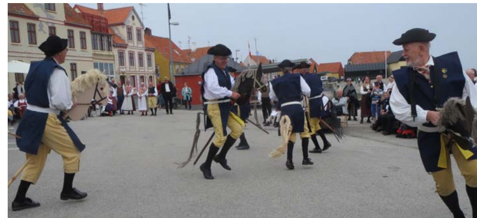
Karoliner stormar in på torget i Rønne – för första gången