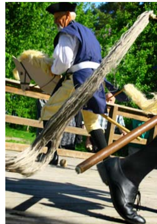
Karoliner till häst