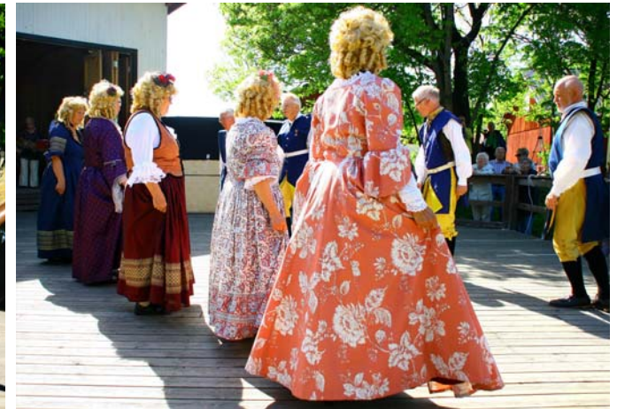
Stiliga damer i vida klänningar och peruk dansar Menuette