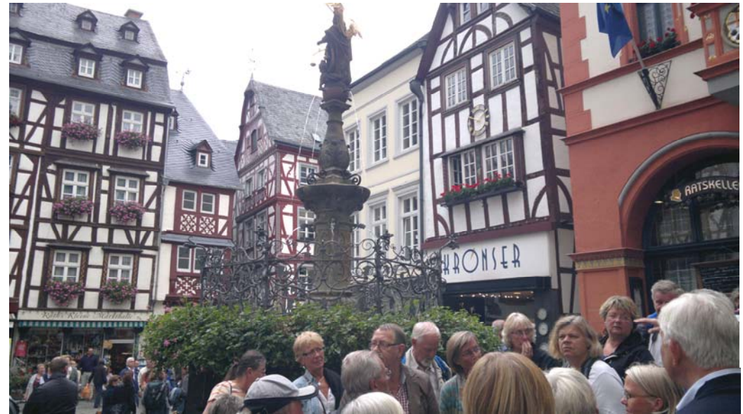
Pittoreska gator och torg i Bernkastel-Kues