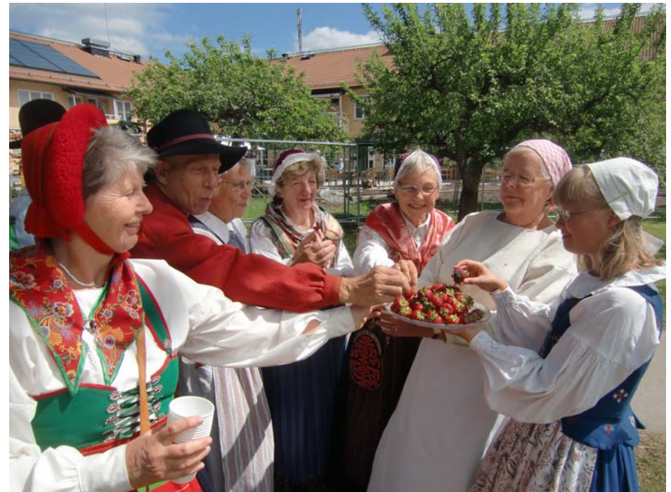
Chokladdoppade jordgubbar smakar mums efter dansen på Brommagården

Till en av midsommarveckans fröjder hör att vi överallt bjuds på välsmakande förtäring, jordgubbar med och utan choklad, sillbord, kaffe, cider och goda kakor. Mmm!