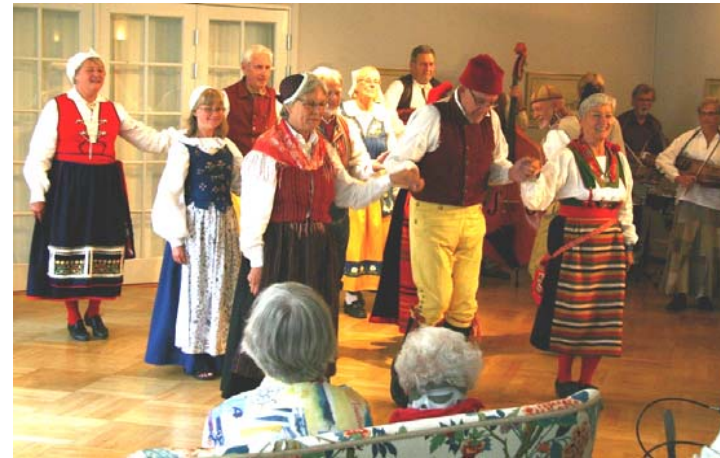
Ryska Polskan ...