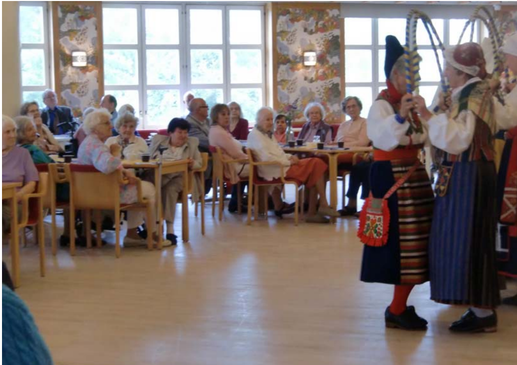
Åskådarna beundrar bågansen