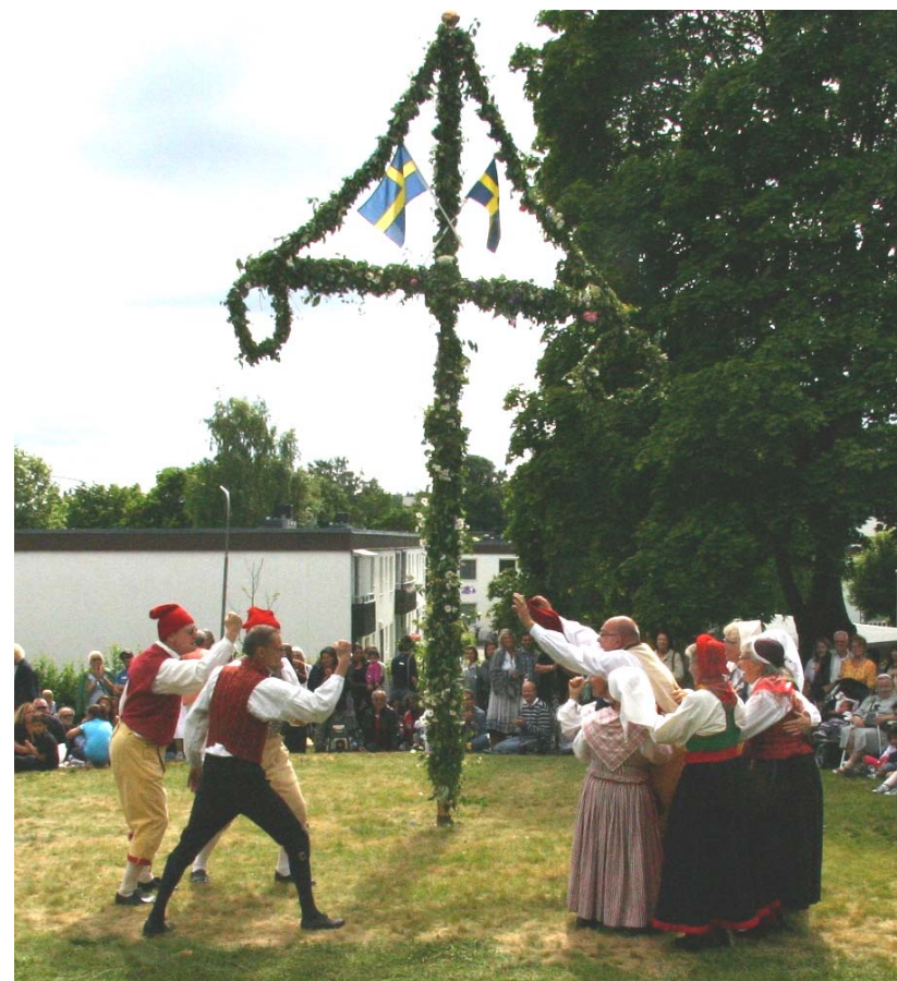
Ove stal alla flickorna i Ryska Polskan under publikens fniss och skratt