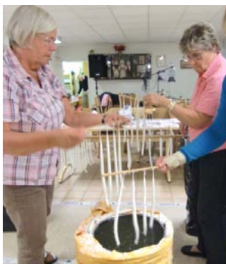
doppa, doppa, doppa