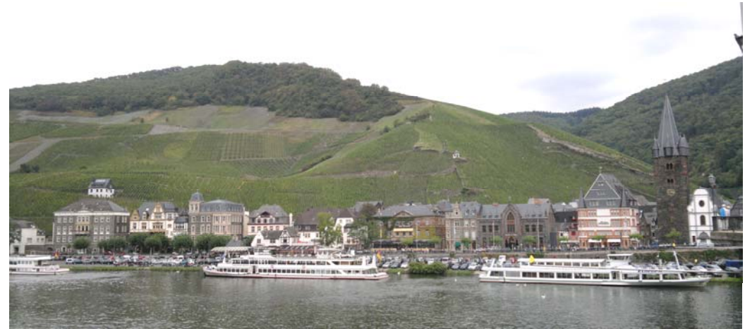
Bernkastel-Kues med rader av vinstockar på slutningarna