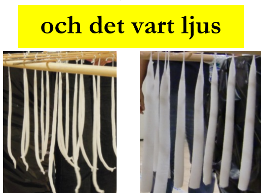
smala och krokiga till