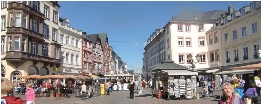
Stora torget i Trier med vinbaren i mitten