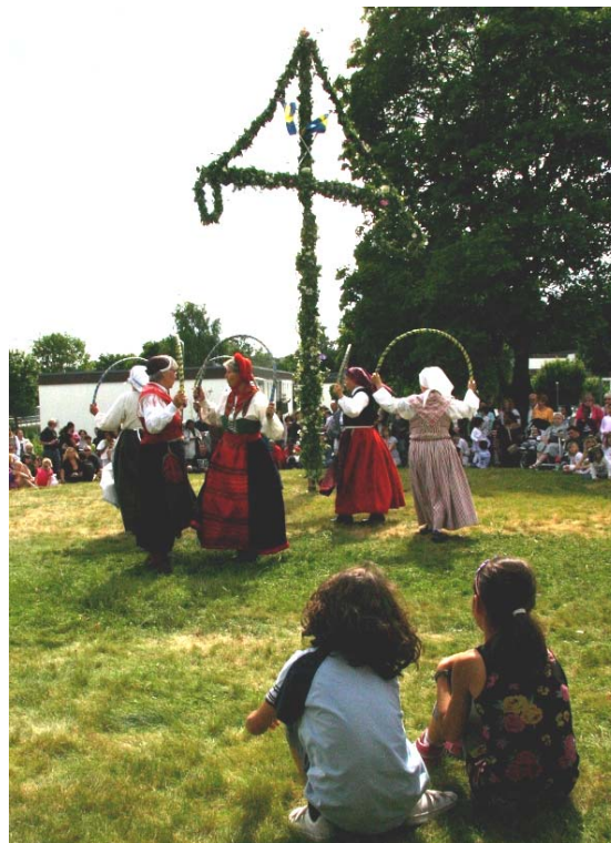
Vad gör de med bågarna?