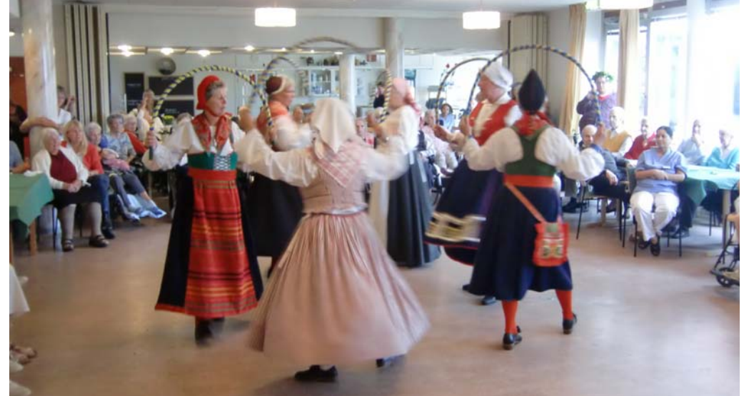
Bågansen på Skoga