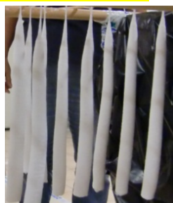
tjocka och raka - nåja!