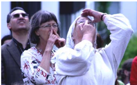
Hej näsan upp - ända upp i himlen