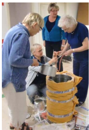
ta bort vatten med hävert,