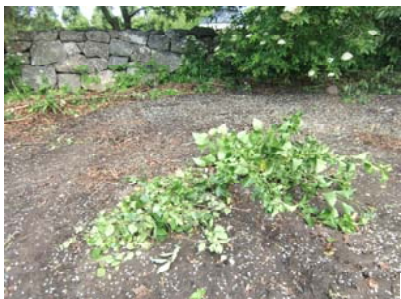
Var är alla björkkvistar? Allt vi samlat dagen innan hade någon städat bort!