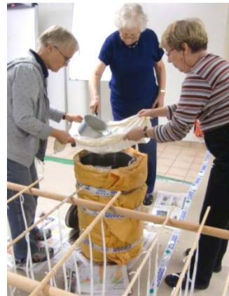
fylla på stearin och