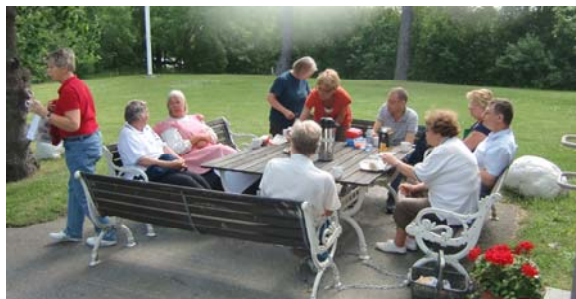
Dags för uppbrott för avresa till Kista Träff