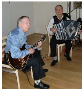
Nisse och Affe spelade både till dans och till saften och kakorna