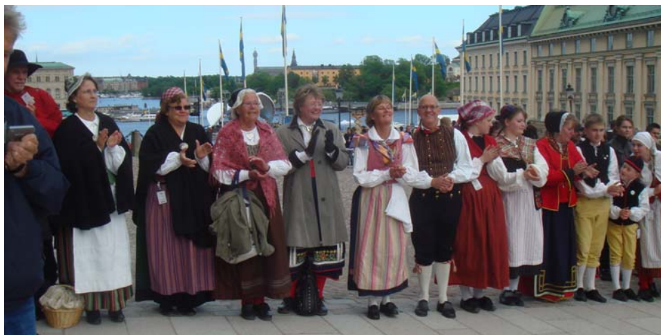
Folkdansare uppställda vid utmarschen efter en lång dag på slottet