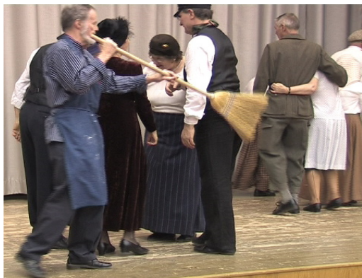
Midvinterstämman i Kallhäll

Men alldeles ohörda är ändå inte suckarna, med drömmar om att rymmas i ett sammanhang. Alldeles oväntat spinner kvasten in sin Udd i ett nät av smäktande dansmusik som han inte kan motstå. Den oemotståndliga musiken och dansstegen som kvasten/drömkvinnan/skogsrået tar med sin Udd i , upprepas danskväll efter danskväll. Man förundras därför inte över Udd'ns iver att sopa golvet rent från alla dansande par. Det var på det tomma dansgolvet hans dröm blev verklighet. Ett drömspel vi i all enkelhet försökt skildra.