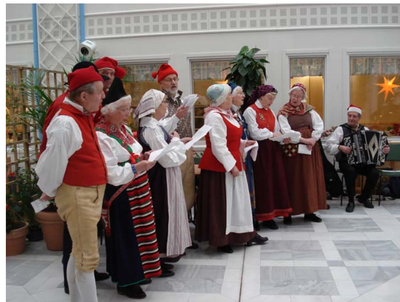
Sångare sjunger julvisor på Skoga äldrecenter i Bergshamra den 11 februari 2007