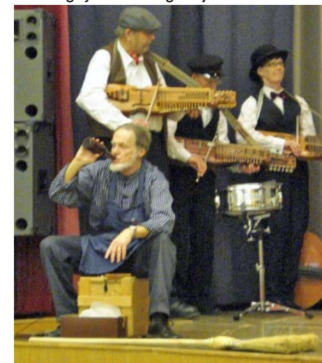
Udd'n wä kwast'n. Kallhäll 17 januari