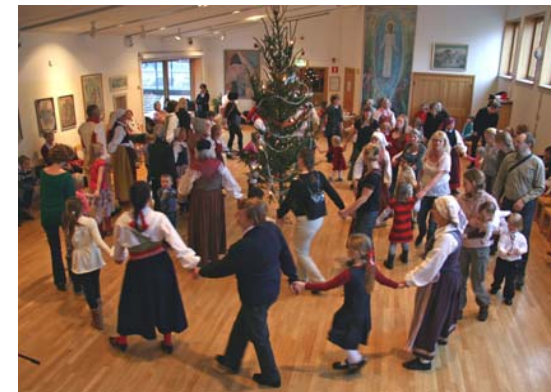
Vällingby församling 10 januari

Att dansa ut julen på barnkalas och servicehus hör ju till våra mest uppskattade verksamheter. I år har vi haft fyra arrangemang, men vi saknade två julgransplundringar för barn, som vi haft under flera år. Är det en tradition, som håller på att försvinna? Då är Vällingby församling ett bra bevis på motsatsen. Gladare barn ser man sällan. Dags för oss att kontakta nya, tänkbara arrangörer och erbjuda våra tjänster?!