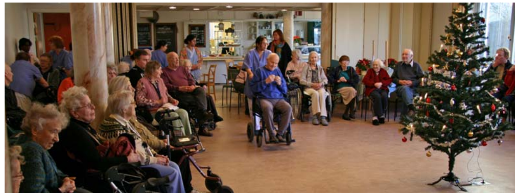
Rullstolsdansare anländer till danslokalen

Vi var tio dansare från Spånga folkdansgille och 2 musiker som ställde upp vid julgransplundringen för de boende i Skoga servicehus. För mig var det minst tredje julgransplundringen jag deltog i på detta servicehus. Jag upplever det som ett nytt rekord när det gäller antalet besökare och även deltagare i de olika ringlekarna. Den begränsade ytan runt granen fylldes fort med rullstolar. Personalen tog upp några boende och några anhöriga kom med sina nära och kära upp på dansgolvet.