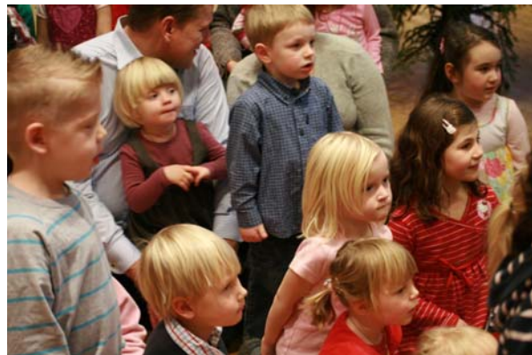
Förväntansfulla barn ...

Kyrkans personal verkade mycket nöjda med oss och var särskilt imponerade av musikerna och sångarna samt att vi var så många folkdansare. Kanske får vi komma tillbaka nästa år??