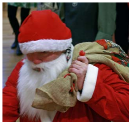
... väntar på tomten

När tomten delat ut godispåsar var glada julen slut i S:t Tomas.