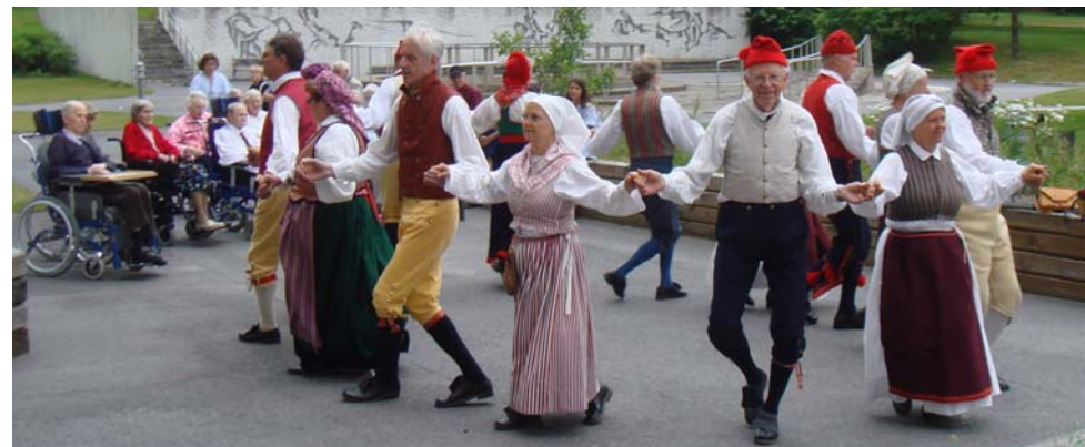
Dans i Råcksta till Annas visa, musik Leif Göras, text Åsa Jinder.

Råcksta äldreboende var nästa stopp. Vår entré brukar vara startskottet för alla boende att samlas vid uteplatsen. En gentleman som kom i sällskap av sin nallebjörn tryggt placerad i den gemensamma rullatorn förkunnade: "Nu kommer det vackra Dalfolket". Han strödde sedan superlativer över oss under hela uppvisningen.