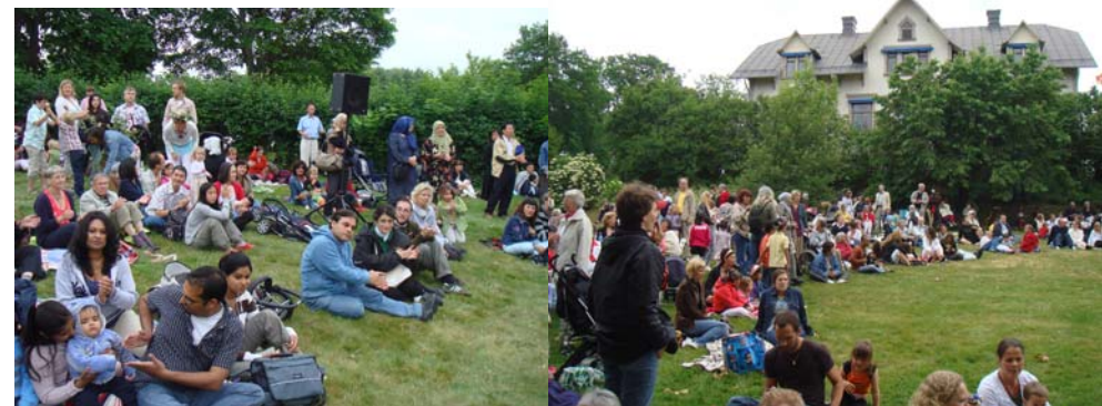
Rekordmånga besökare, många med invandrabakgrund

Om en bråkdel av alla deltagare hörsammar inbjudan till gilletts danskvällar måste vi nog bygga ut Spångafolkan. Skördedansen blev kanske ett dragplåster då den genomdansades riktigt stiligt.