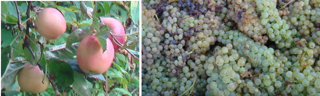
Svenska och Italienska skördar