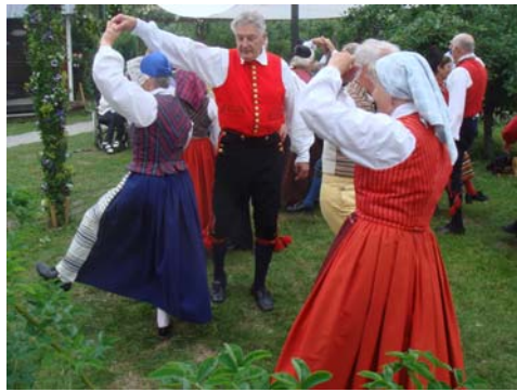
Trångt mellan buskarna och svårdansad gräsmatta medförde vissa missöden men gav samtidigt upphov till många glada miner och skratt