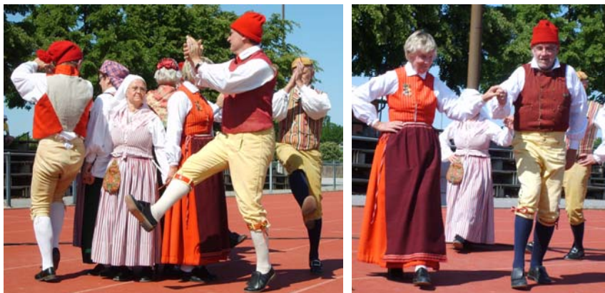
Vindmölledans och midsommarhambo på löparbanan