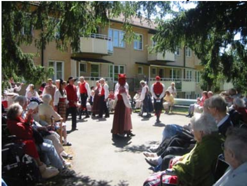
Inmarsch mellan åskådarna och granarna