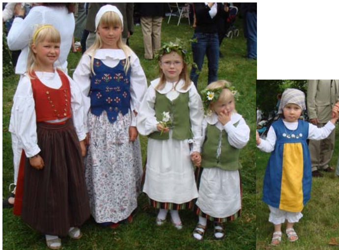
För framtiden - fina flickor i folkdräkt