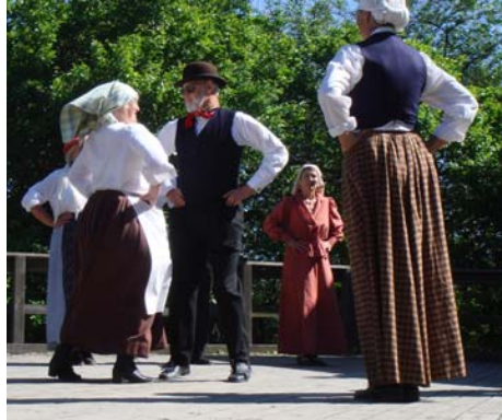
Handpolska och Trekarlpolska