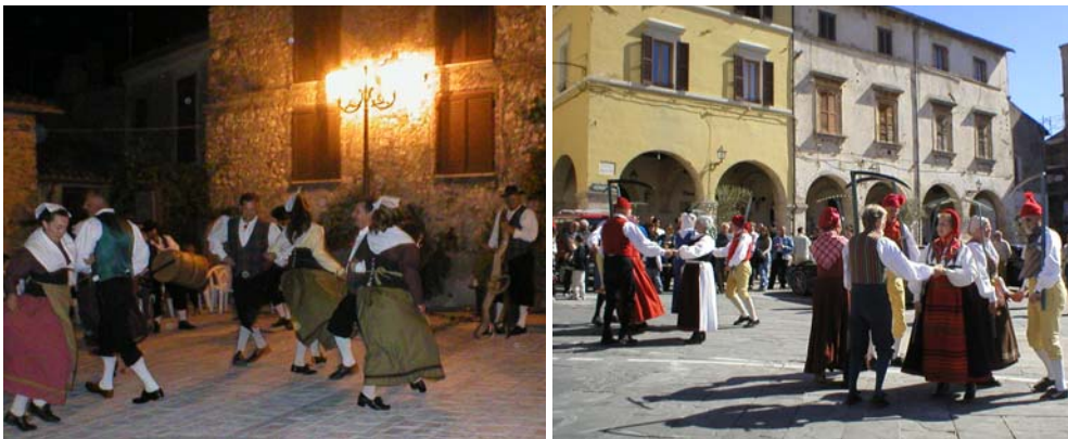
Ornaro folkdansgrupp i skymningen och skördedans i Chittaducale