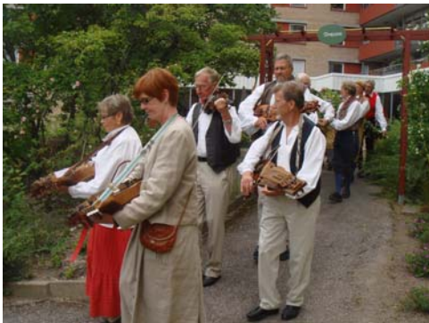
Trätakt i täten när den mycket fina midsommarstången bars ned till väntande åskådare och åhörare