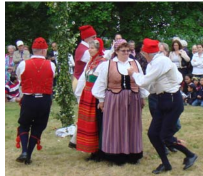
... och runt i vindmölledansen