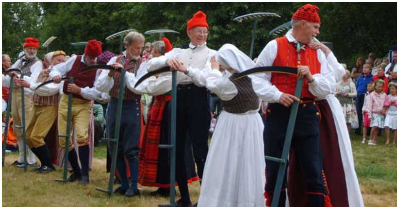
... efter flirt i skördedansen