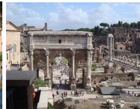
Forum Romanums ruiner

43 förväntansfulla folkdansare flög från fosterlandet 24/9 för helt okända dansäventyr i Italien. Guidade av Roland och Giuliana Ekström tog vi oss an ett väl genomtänkt och späckat veckoprogram.