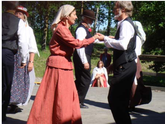
Schottis från Idre och Mäse Kadriļ