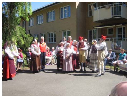
Här sjungs "Visa vid sommartid" och "Hur skall jag få veta, om du håller av mig ..."