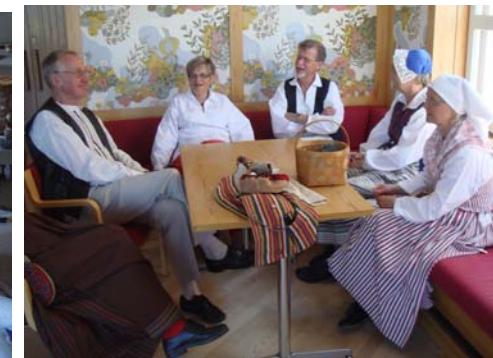
Skönt att slappna av i den rymliga och trivsamma lokalen före uppvisningen tycker musiker och dansare

Bergshamra onsdagen den 20 juni kl 15:00