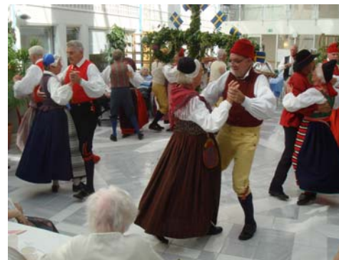
Dans runt stången i den ljusa lokalen i Bergshamra

När vi kom till Bergshamra för dagens sista framträdande var vi helt klart uppvärmda och missade turer var det nu ont om.