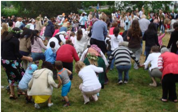
... och än slank han ner i diket ...