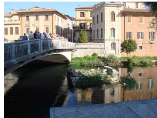
Bro på "Via Salaria" (saltvägen) i Rieti