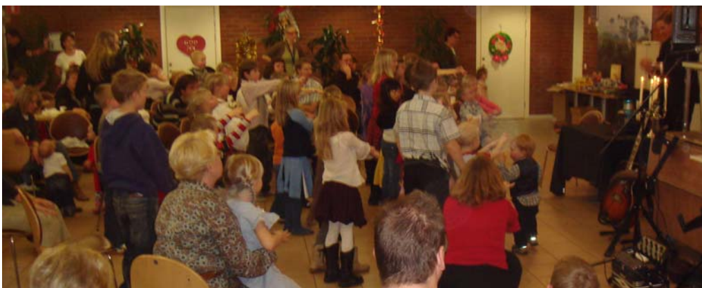
Trollkarlen skojar med både barn och vuxna