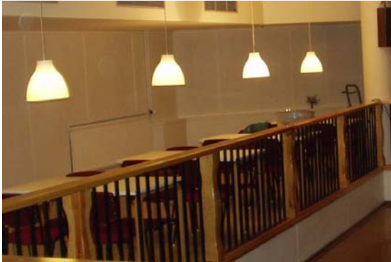
Nya, fina armaturer på balustraden

Dörren är av stål och på karmen sitter en hemlighetsfull kodlåda. Här inne finns tydligen något värdefullt! Skyltfönstret bredvid berättar att det är dans och musik. Du öppnar dörren, som varken kärvar eller knarrar som förr, öppnar ytterligare en dörr och kan stiga nerför en nylagd och nymålade trappa och vid dess fot luktar det..