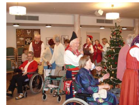
Visst kan man delta även om man sitter i rullstol.