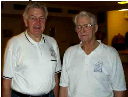
Grabbarna som räddat golvet, som räddat Spånga Folkan, som räddat Spånga Folkdansgille från hemlöshet

Hur hade golvet sett ut om det inte sköts minutiöst under alla år? Utslitet! Två av