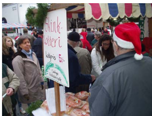
Stundtals mycket folk vid stånden