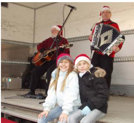
Två strån spelar till dansen