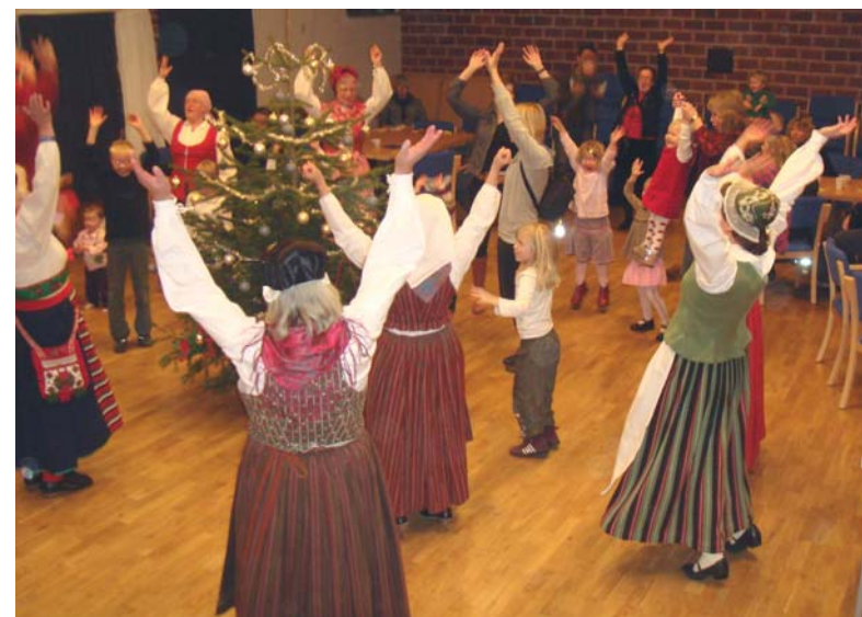
Raketen far iväg så taket bågnar och speglarna bakom förhängena till vänster darrar.