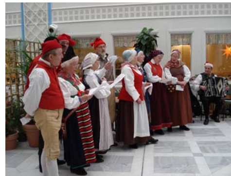
Alla sjunger julvisor och i bakgrunden syns ett av Två Strån.