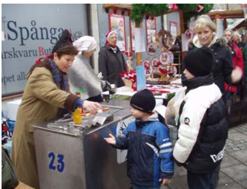
Korv, korv, korv