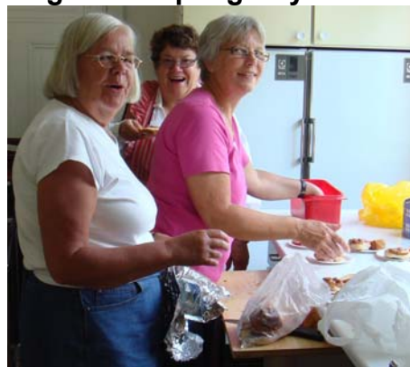
Förberedelse i köket med kaffekokning mm och med blomsterpyrdning av midsommarstången ...