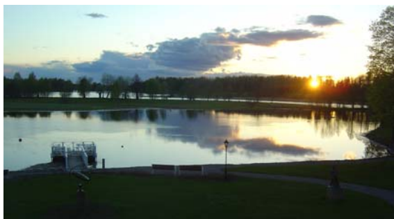
Solnedgång över Dalälven