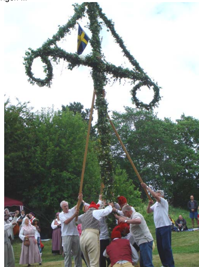
... och så var det dags för resning av stången med förenade krafter,