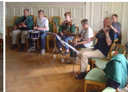
Trätakt lika tålmodigt spelande som alltid