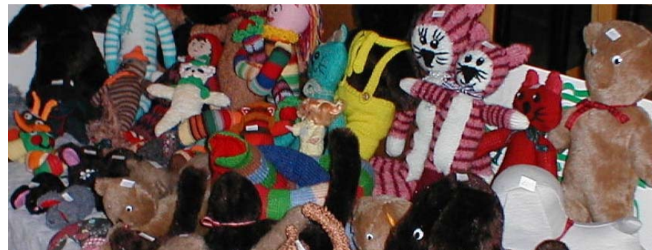
Julmarknaden i Spångafolkan 2002

Sy, sticka, slöjda i trä eller göra något annat du själv gillar.