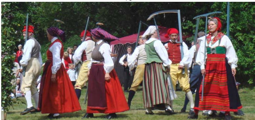
... för skördedansen ...