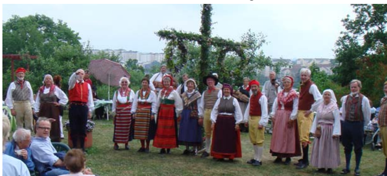
Uppvisningarna avslutades med presentation av dräkterna från norr till söder.