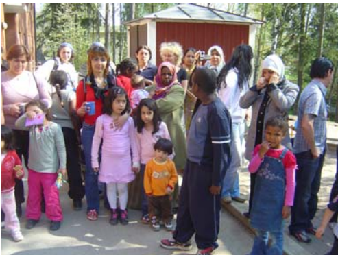
Förväntansfulla barn och dansare lyssnar på fiol och nyckelharpa före dansen