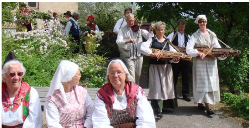
Inmarsch med Träakt i tåten framför midsommarstången