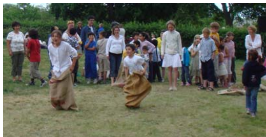
... och kämpalekar för barnen.