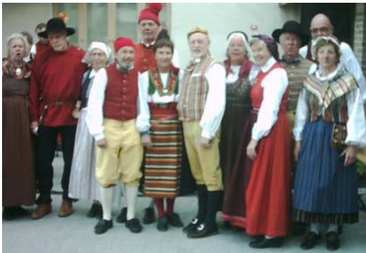
Spånga folkdansgille i färggranna dräkter