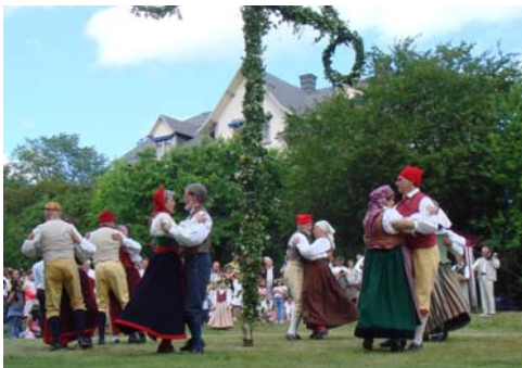
... och andra danser