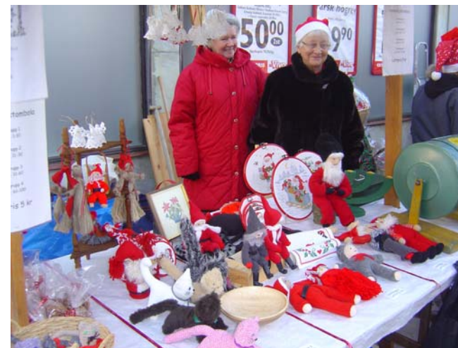
Julmarknaden på Spånga Torg 2004

Prylar till loppis. Allt som är i gott skick kan vi ta emot, men leksaker till barn är extra välkommet.