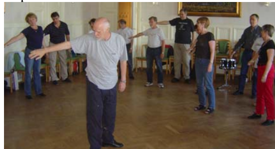
Chi Gong inspirerad övning