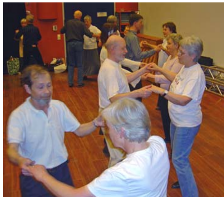
Spånga- och Nackadansare blandade