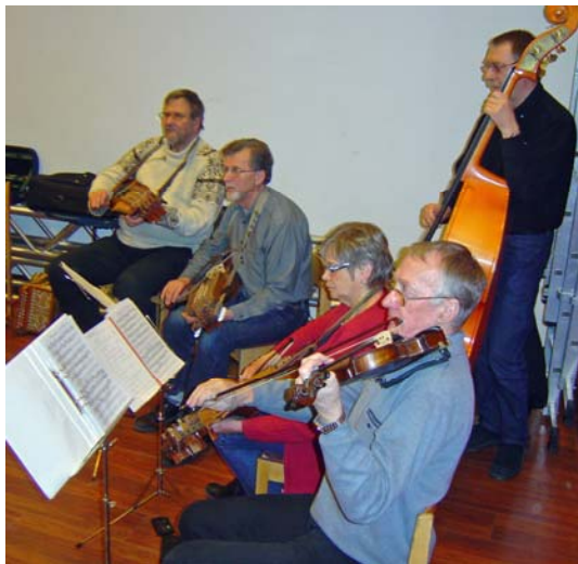
och Trätakt spelade

Danskvällen avslutades med gemensam samling och sång – i klunga vi sjunga – och till hemmet glatt det bar i olika grupperingar.