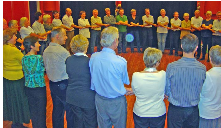
Och leken slutar här ...

Liten presentation av Nacka hembygdsgille: