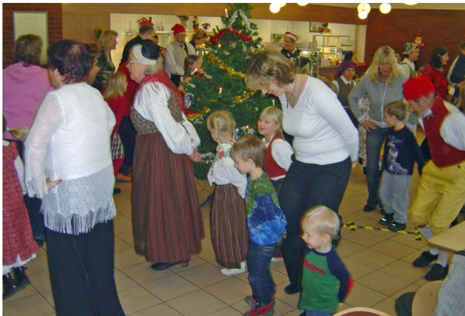
"Små grodorna" förstås