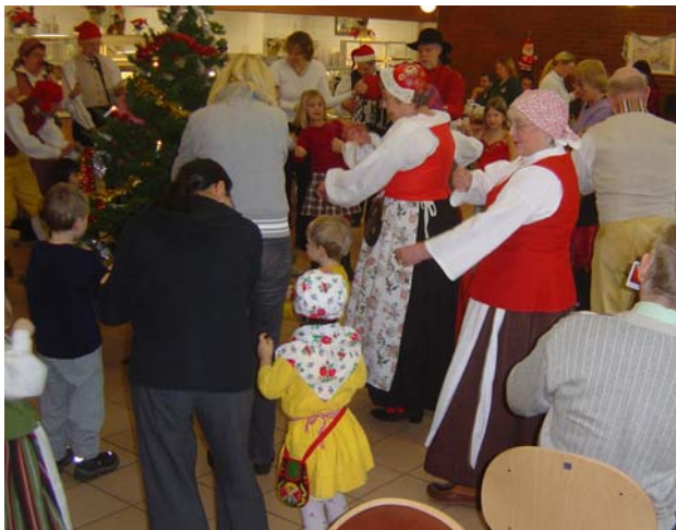
"Skära, skära havre"