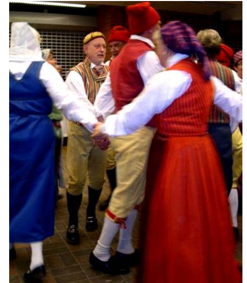
... och spångadansarnas uppvisning