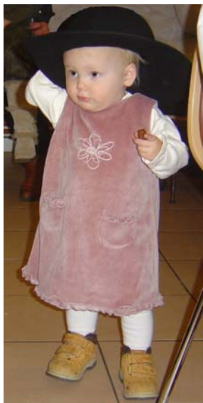
Fin i Kenneths hatt