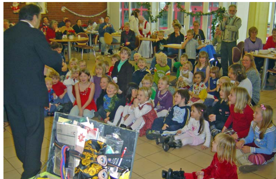
Trollkarlen trollbinder barnen