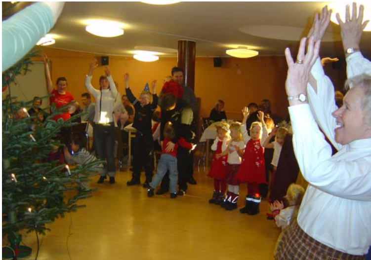
En raket på gång att avfyras

Festen avslutades efter ett par timmar med fiskdamm där barnen fångade godispåsar, som Björn Begner AB hade sponsrat. En lyckad fest, som vi redan beslutat återkomma med, söndagen den 21 januari 2007.