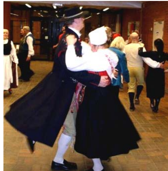
Stadsmuseums dansare ...