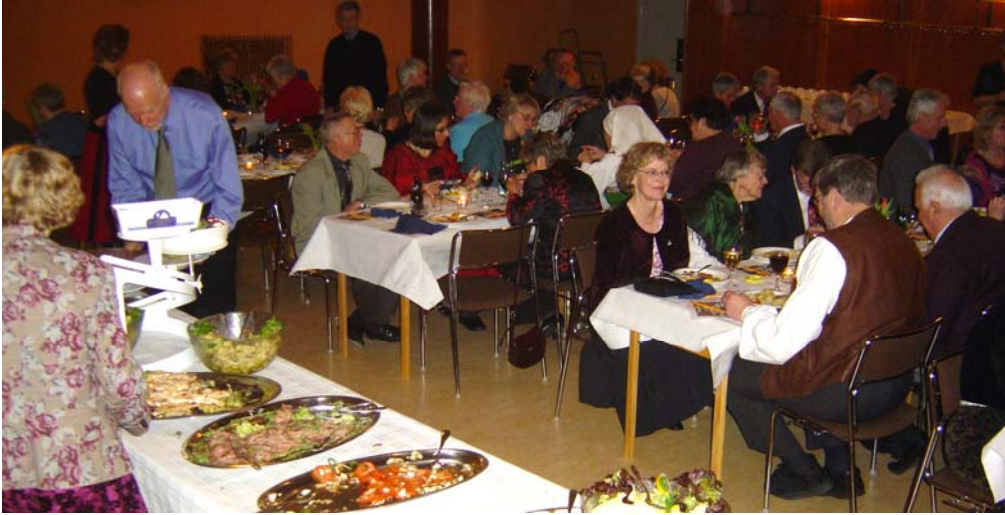
Maten låter sig väl smakas