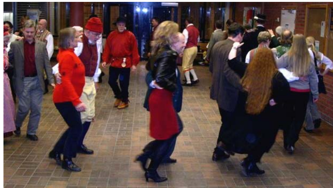
Gemensam schottis dansbenen.