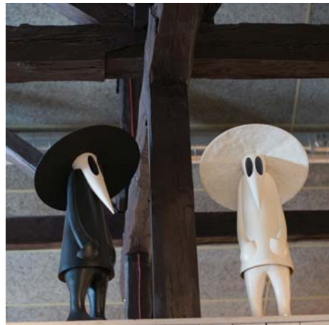
"Två små fåglar på en gren ...", tja, dom satt uppe under takåsarna i Lasse Åbergs Museum