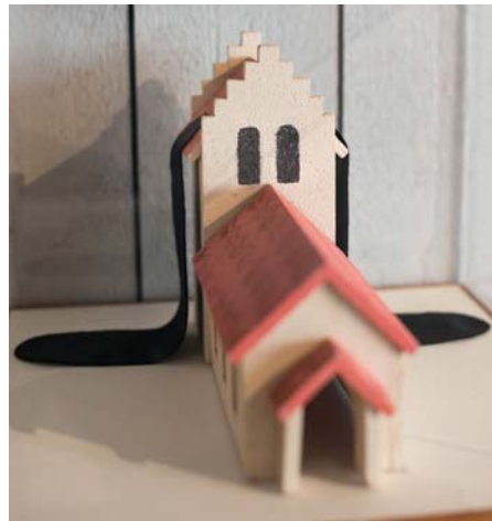
En ovanlig variant av Långbens huvud