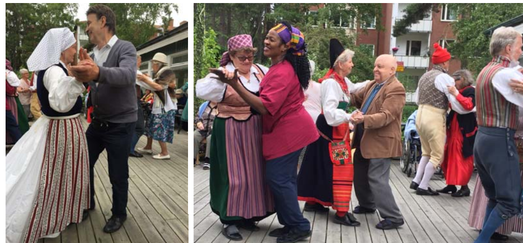
... sedan dansade vi med åskådarna.