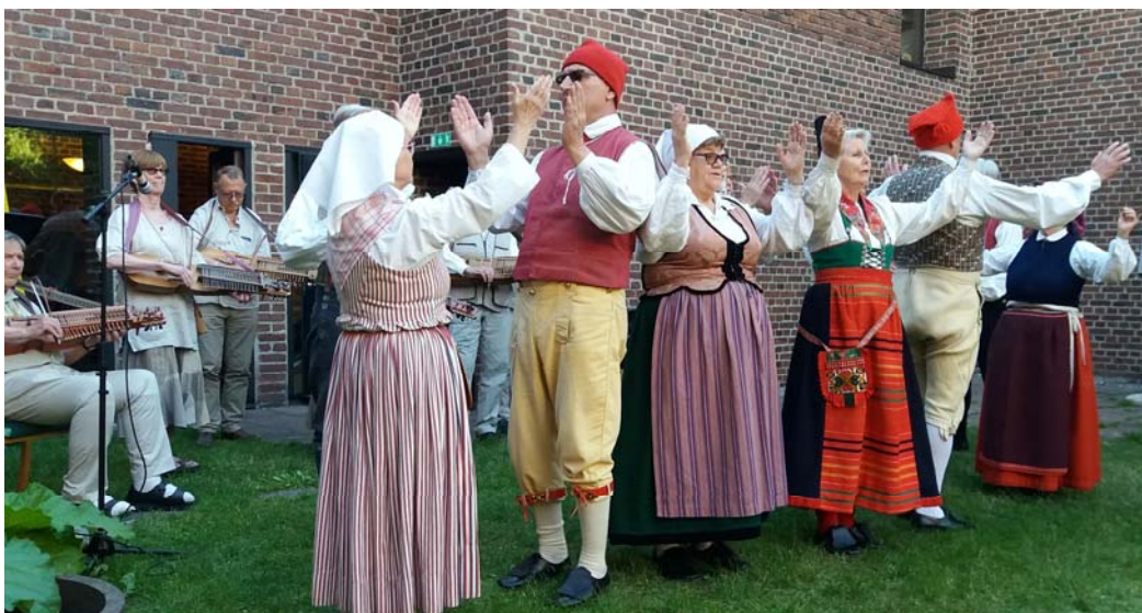
Trätakts andra uppdrag denna dag i trädgården S:t Thomas kyrka