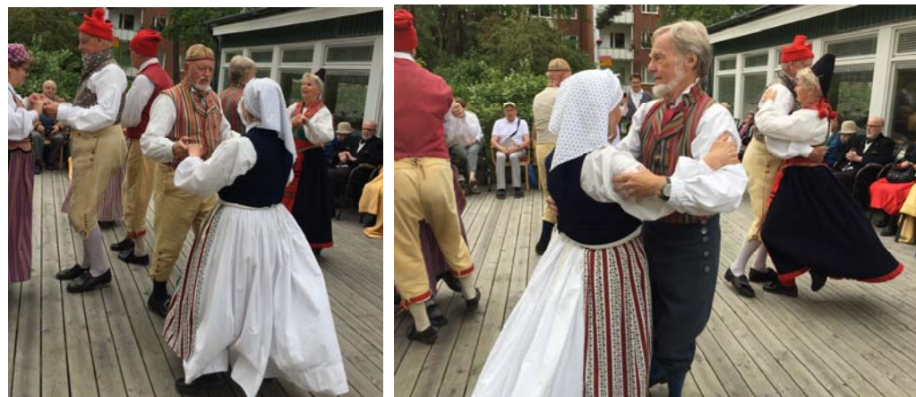
Först hade vi vår uppvisning ...