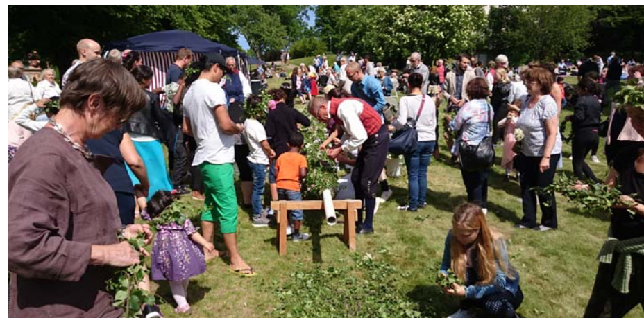
Majstången pryds med blommor ...