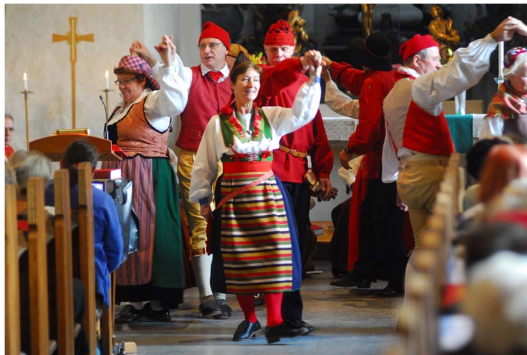
Spånga kyrka 2007