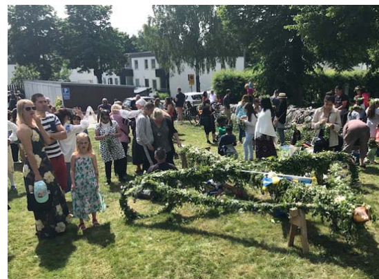
...är färdig att bäras fram