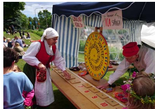
Chokladhjul och kaffekokare inför anstormningen