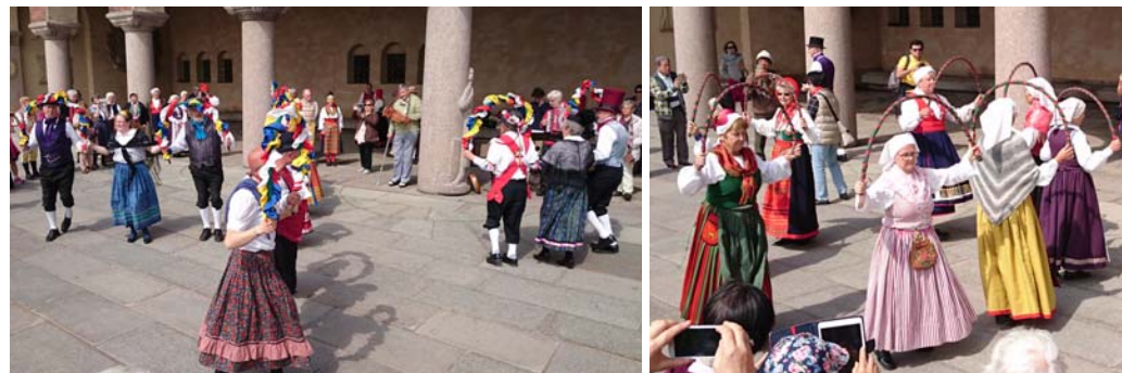
Bågdansen i engelsk och svensk tapping