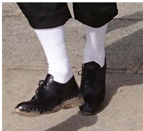
med steppjärnsförsedda träskor