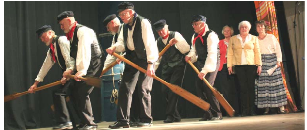
Postrodd över Ålands hav