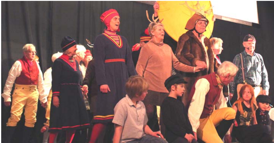
Sameflickor, renar, rentjur, buspojkar och turister under midnattssolen