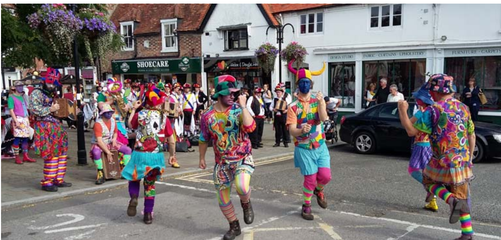
Vid vårt besök i England fick vi se dessa färgsprakande dansare. Våra karoliner förefaller bleka i jämförelse med dessa (men de har inga hästar) Foto