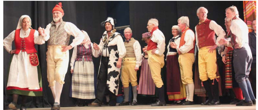
Till slut kunde även kossan dansa Hälsingehambo