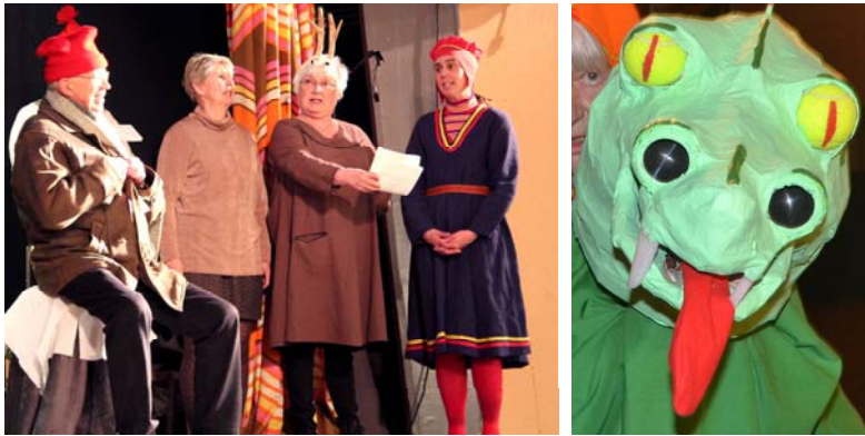
Jämtgubben satt i Äre och frös och det förskräckliga Storsjöodjuret skrämde publiken