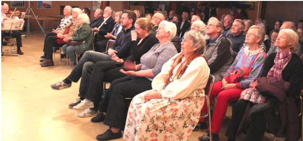
Publiken följde uppmärksamt med på resan