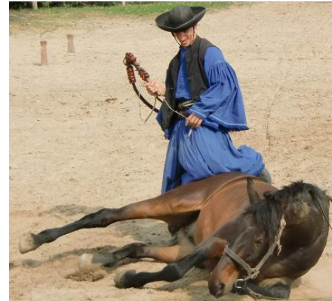
Dressyr och Csardas