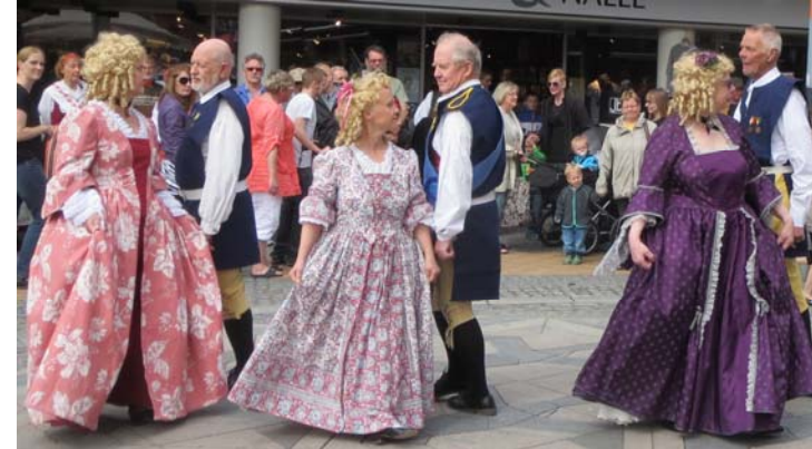
Menuett och utklädda damer dansar Oxdansen