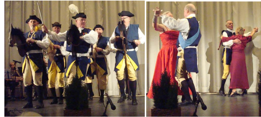
Kallhäll: Karoliner framåt !!