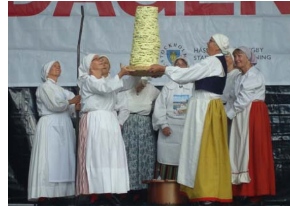
Spettekaka och storsjöödjur