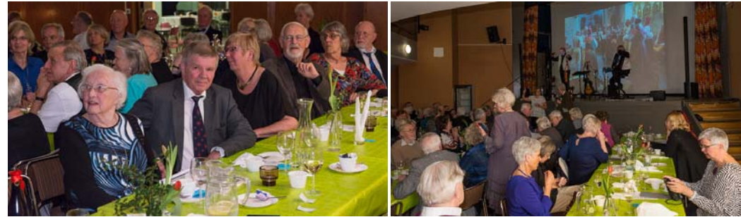
85 personer vid långbord och bildspel på filmduken.