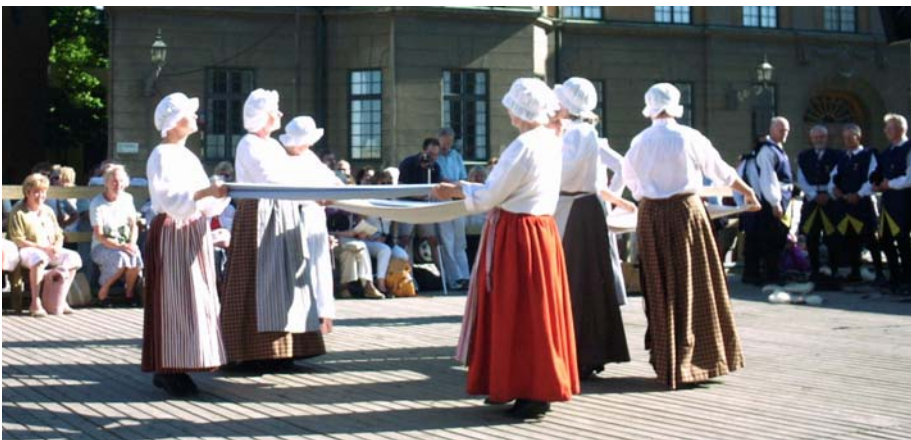
Väva vadmal med lakan