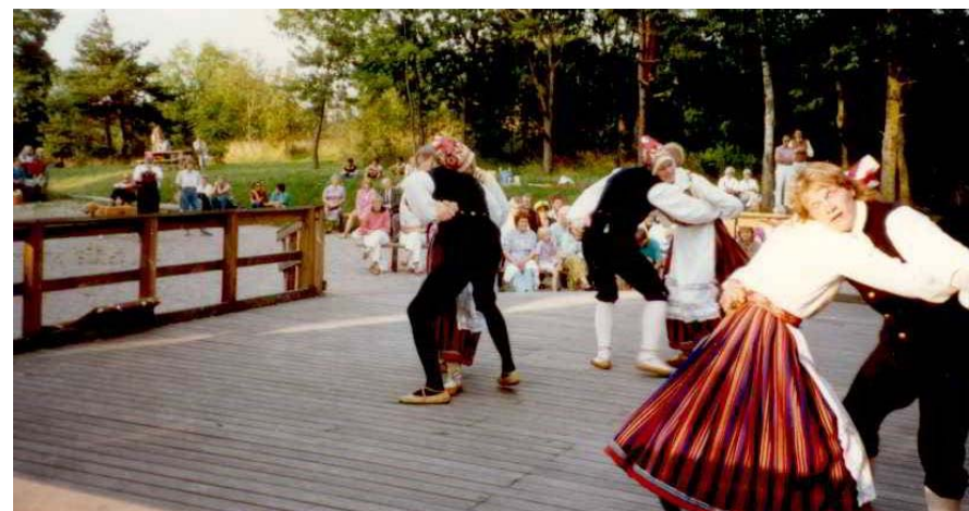
Gubbstöten på estniska med dansgruppen Kevade