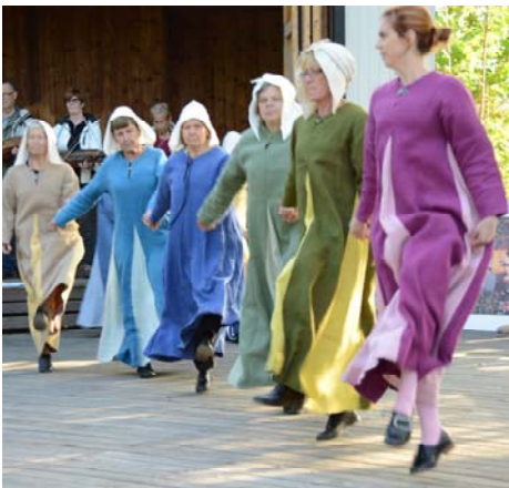
Eggeby: Indans till Saltarello, Galopp och Charleston