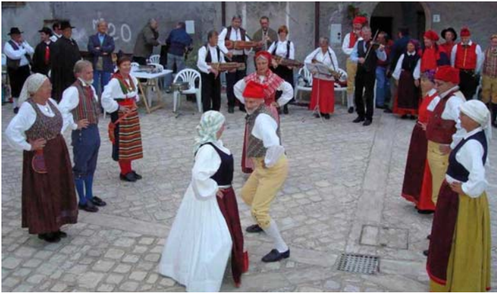
Trekarlpolska i Oliveto