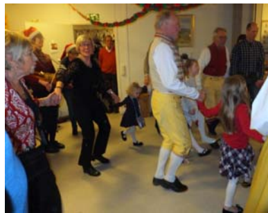
Dans i dubbla ringar