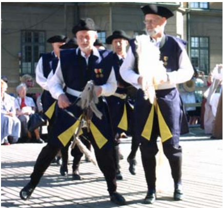
Ryttarna stormar in