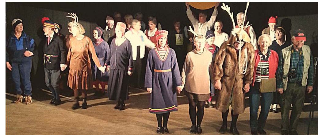
Sameflickor, renar, rentjur, samepojke och midnattssol