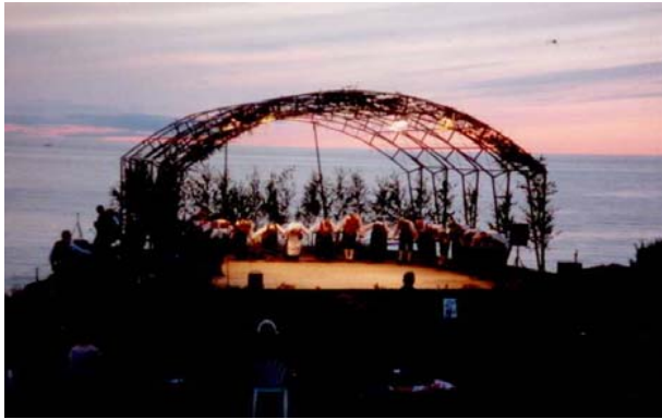
Folkdans tillsammans med Syriska Föreningen och helstekt lamm på Änget