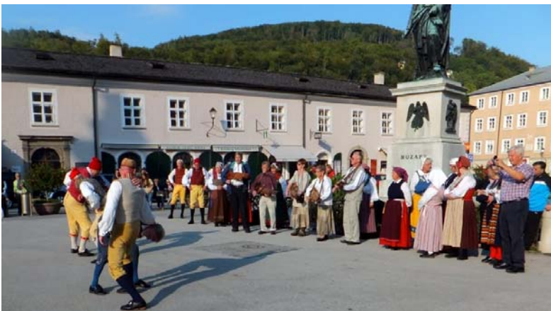
Spontan dansföreställning på Mozartplatz