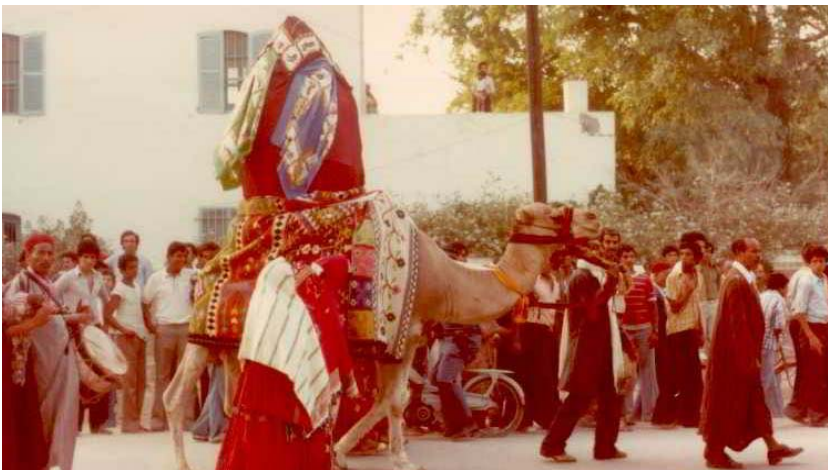
Tunisien 1979