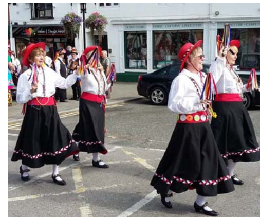
Vackra damer och fantasifulla dräkter