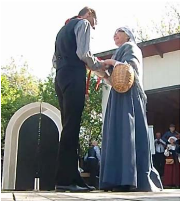
Eggeby: "Två ögonpar varandra trår" brudgum och brud