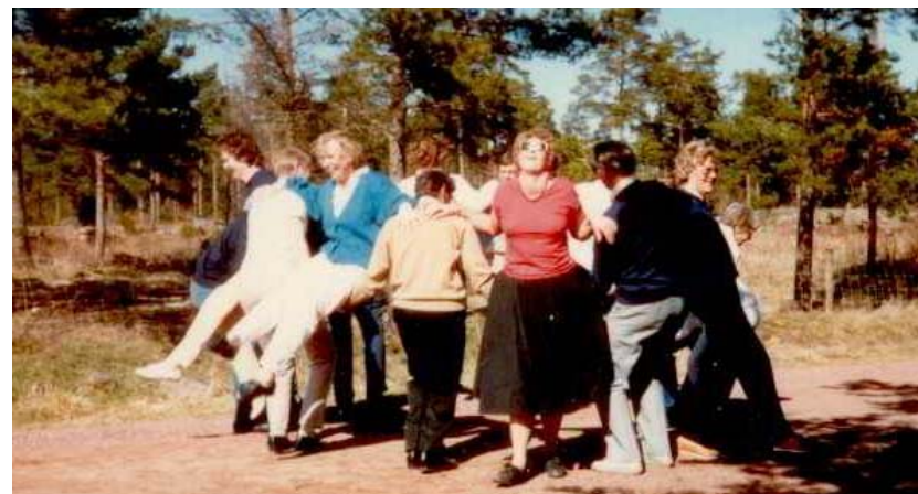
Träning i det fria inför uppvisning på Åland 1987