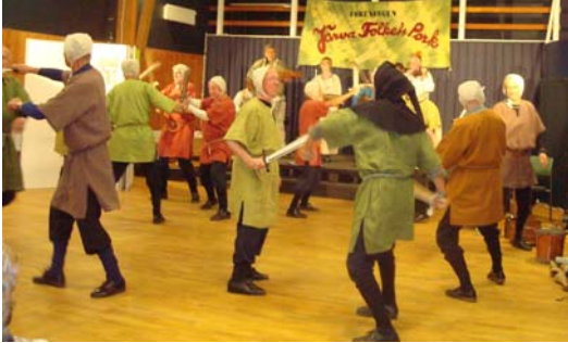
Svärdsdans på Eggeby Gård och Nertes i Kungsträdgården