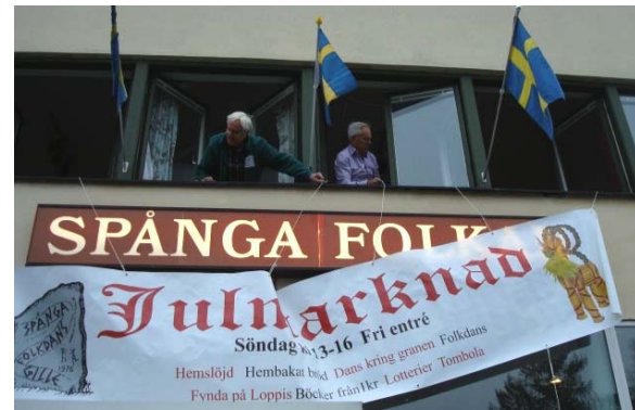
Upp med banderollen som syns från gatan.