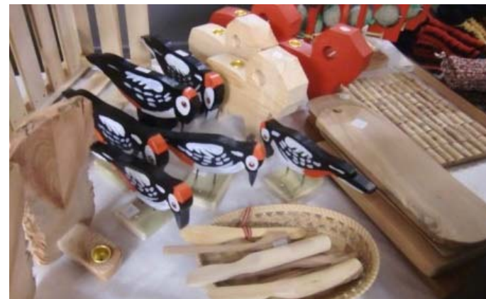
Träslöjd av många slag, praktiska och vackra och en stor flicka på liten gunghäst