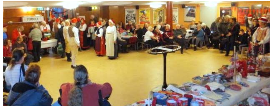
och dansarna ställde upp sig inför intåget innan ljuset släcktes