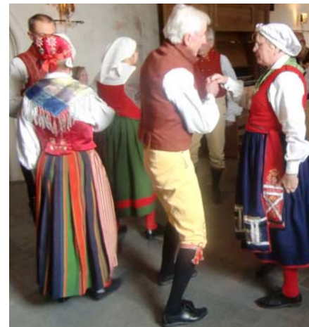
Schottis i turer