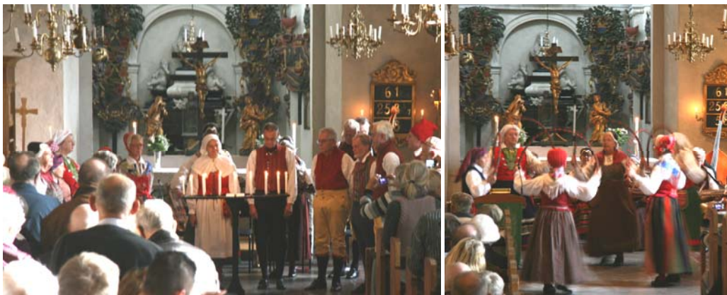
Alla ljusen på plats

Utan "vårt" spelmannslag skulle inte någon av våra uppvisningar göra sig alls, de sirar ut musiken och manar oss dansare till stordåd. Som avslutning spelade Trätakt Munga-låten under hela uttåget ur kyrkan. Ett mycket uppskattat sätt att avsluta en gudstjänst.