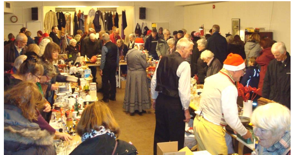
Äntligen ordentligt med plats för en stor loppis