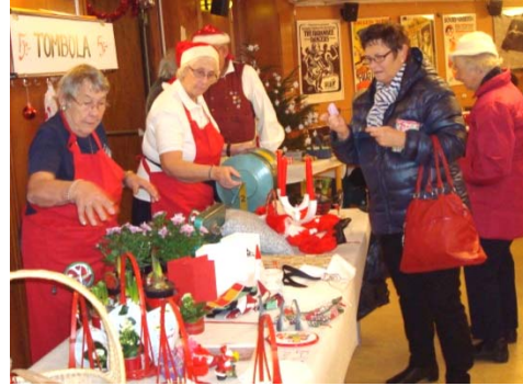
Full fart på serveringen av kaffe, bröd och smörgås. Full snurr på tombolan också