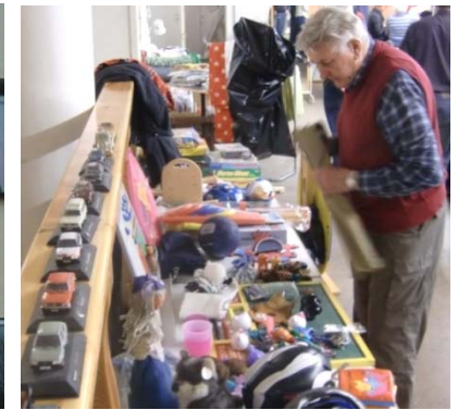
Hasse kollar bordet med leksaker