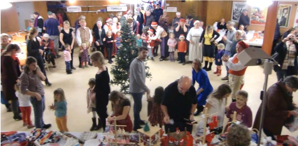
Stor ring med många, glada barn dansade kring en liten gran