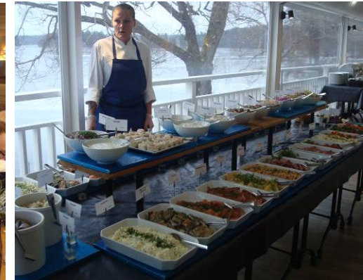
och här är den uppdukad