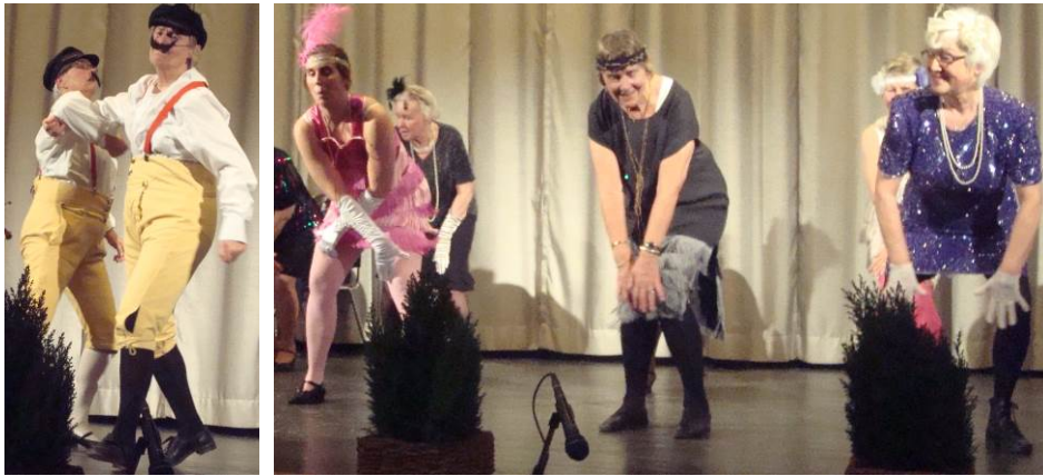
Oxdansen på nytt sätt Charleston