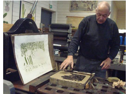
Litografiskt handtryck kräver många stenar,