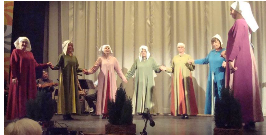
Damerna dansar Saltarello