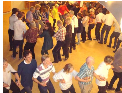
Sollerön som en lång orm