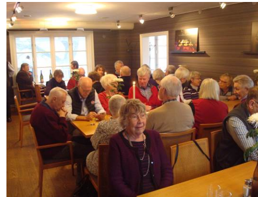
I väntan på mat