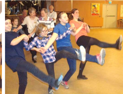
Palais Glide - vem sparkade högst?