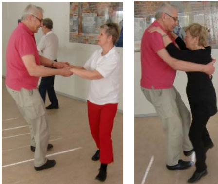
Rätt fattning i Slängpolska och Bondpolska

Jag beundrar flera av våra damer som lyckades tillägna sig både dam- och herrsteget och hade järnkoll på sin roll för tillfället. Jag kände mig mest som både Toket och Prosit på julafton.