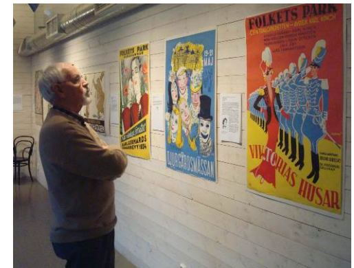
men resultatet kan vara värt att beundra.