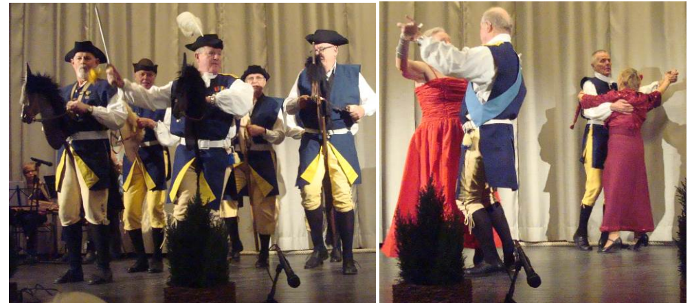
Och sedan galopperade Karolinerna in