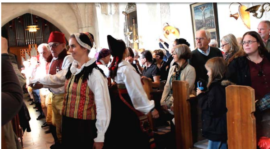
Indans till Saltarello långdans

Söndag 27 oktober 2013 blev Spånga folkdansgille och musikgruppen Trätakt återigen välkomnade av Spånga kyrka till gudstjänst med dans och musik. Redan halv elva var kyrkan fullsatt. Extrastolar och ståplatser vittnade om hur uppskattad denna tradition är.