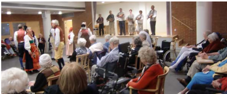
Mossfe, en stillsam och sirlig dans

Efter danserna kom personalen med vackra rosor som de lämnade till de boende som i sin tur delade ut dem till oss. Synd att så få dansare från folkdansgillet kunde ställa upp denna gång. Vi återkommer med glädje.