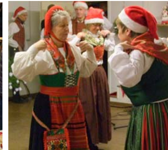
Damerna slåss om tomtens paket