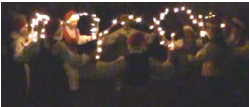
Dans med ljusbågar (videoklipp)

De första timmarna såg det ut att knappt finnas ståplats och ännu mindre en ledig stol att sjunka ned på för kaffe med vårt smarriga, hembakta bröd. Det är riktigt roligt att se hur resultatet av vårt arbetes möda är så åtråvärt, både hantverk, bröd och lotterier. Chokladhjulet är lika populärt sommar som vinter.