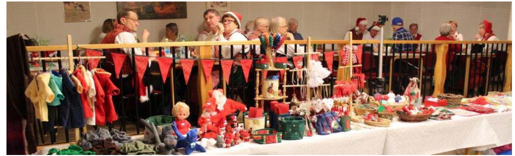
Samling inför invasionen av marknadsbesökare