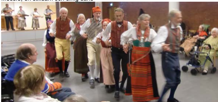
Utdans till Sollerön med Trätakt på scenen i bakgrunden