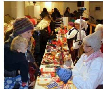
Flera vid julpysselbordet