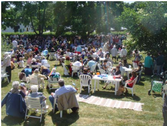
Skönt i solen