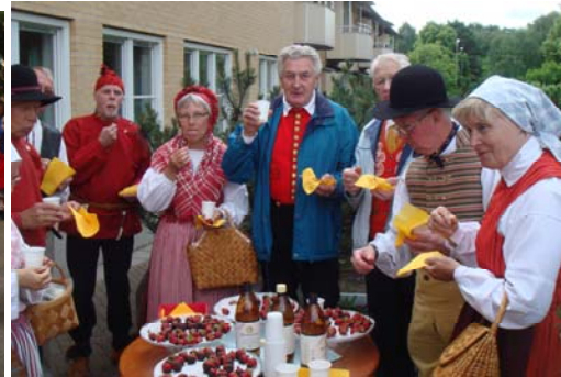
Choklad-doppade jordgubbar- mums-mums