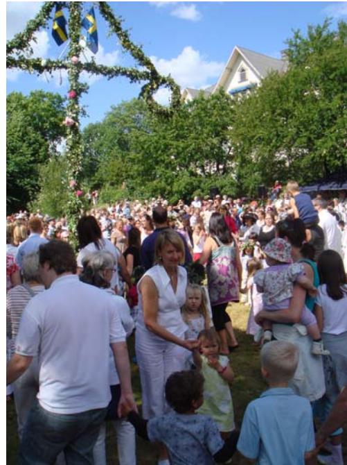
Trångt mellan ringarna bland stora och små