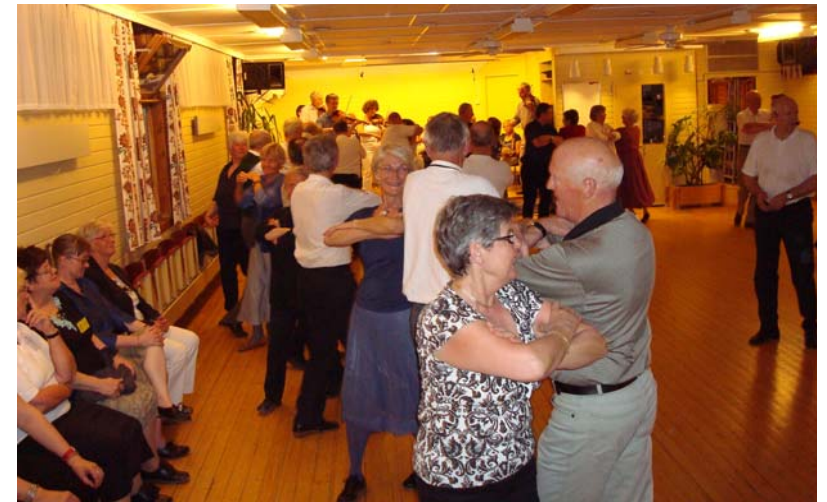
Flitigt dansande i Östersundarnas egen danslokal Tiljan.

Huset är dala-inspirerat och med en tämligen speciell planlösning. Till exempel finns en titlucka på söderbalkongen där PB kunde se, om gästen som knackade på, var önskvärd eller inte. Som flyktväg använde han en för ändamålet byggd trappa.