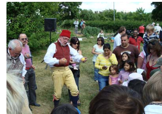
Jah! Där satt den!