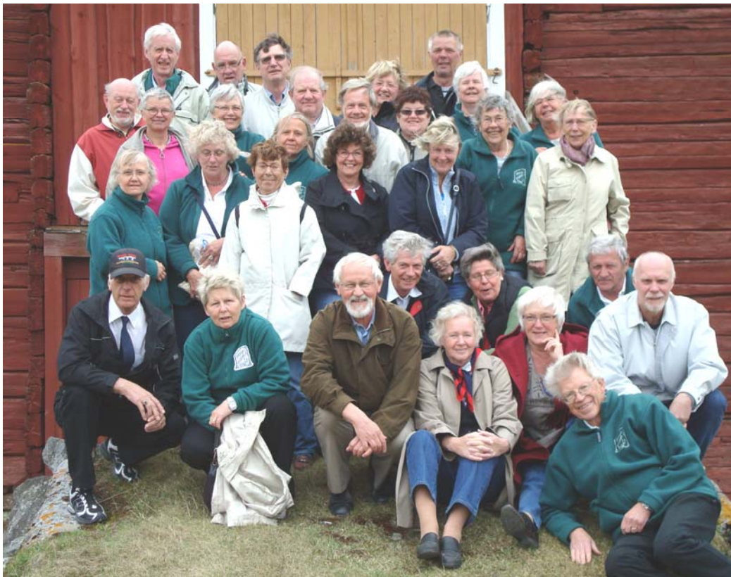
Gruppbild i snålblåsten på bron till Idas midsommarloge ...