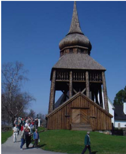
Klockstapeln vid Frösö kyrka

Därefter bjöds vi att sitta ned en stund i Frösö vackra kyrka från 1100-talet. Vid en renovering på 1900-talet hittade man en mängd benbitar på korets nuvarande plats och konstaterade att detta varit en forntida offerplats. Platsers skönhet hade tydligtvis dignitet även för våra förfäder.