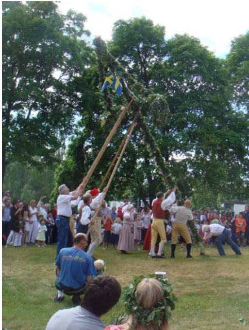
Å hej, å hej! Även publiken hjälper till