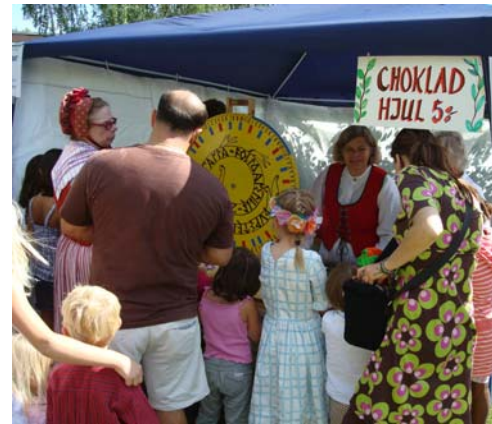
Chokladhjul kan aldrig bli omodernt