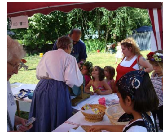
Nästan ingenting kvar, men spännande ändå