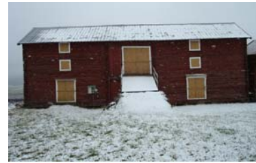
Idas midsommarloge tre dagar senare