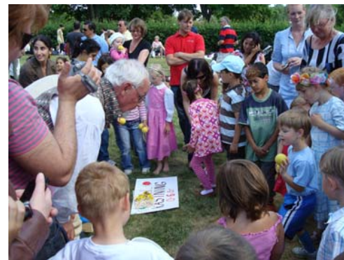
Nu gäller det.