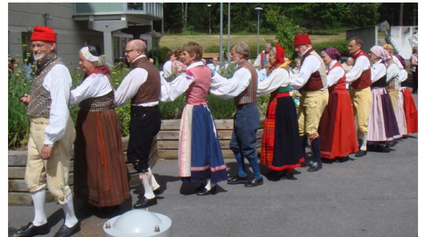
Indans till Sollerön