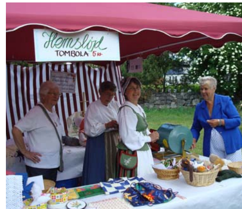
Fullt av hemslöjd.