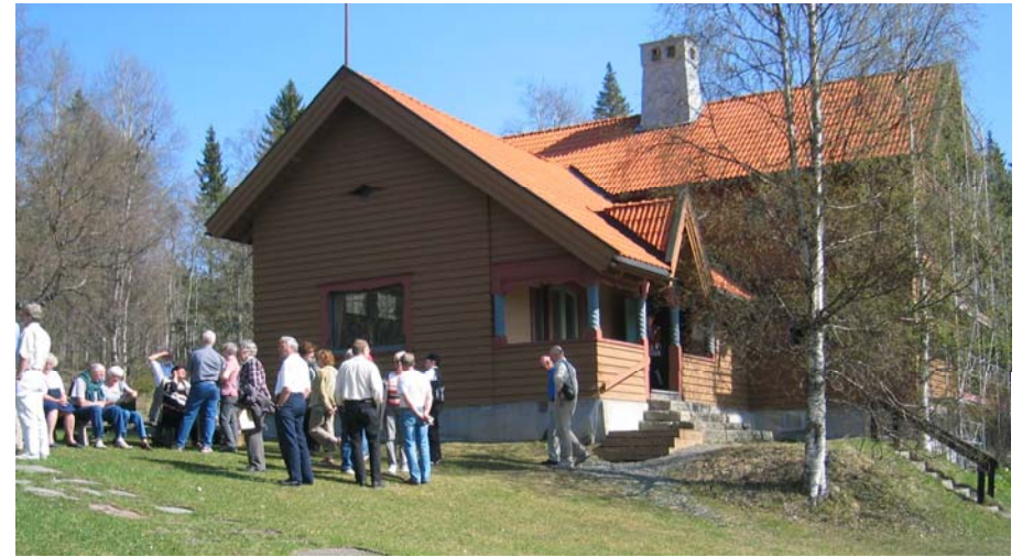
Vid PB:s Sommarhagen

Petersson Berger (allmänt kallad PB) var under många år en ständigt sommargäst på Frösön. Men först i 40-årsåldern köpte han en egen tomt och byggde sig ett sommarhus som senare blev permanentbostad. I stora sällskapsrummet har man bevarat hans flygel vilken fortfarande används vid mindre konserter.