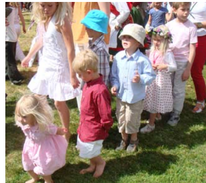
Många små grodor så klart