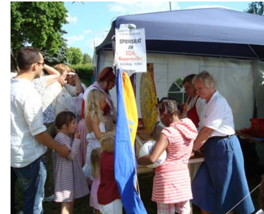
Kön vill aldrig ta slut trots att klockan var långt över fyra