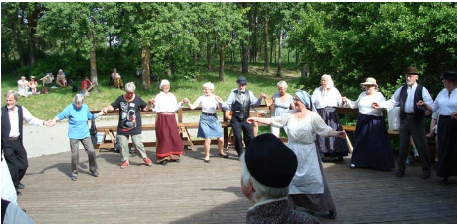
Kort danskurs vid Eggebystämman