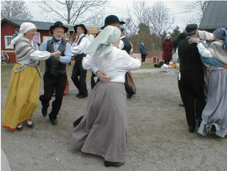
Eggeby Gård 2001

Den här boken vänder sig till dig som tycker om att dansa. Anatomi betyder ”läran om den levande kroppens uppbyggnad” och det är ju kroppen du använder när du dansar, fast du kanske glömmer bort den när du får upp farten. Du tänker på musiken, rytmen, stegen, på din partner och alla de andra omkring dig. Om du dansar folkdans eller gammeldans föreställer du dig kanske hur folk förr i tiden kände när de dansade samma dans som just nu fånglar dig. Hur de levde, vilka kläder de bar, hur de upplevde dansens gemenskap. Säkerligen tänkte de inte på att göra rörelserna ”rätt”, att dansa ”i god hållning”, inte ”vingla på fötterna” och så ska inte heller du tänka. De upplevde dansen i sig, som den var och vad den betydde för dem.