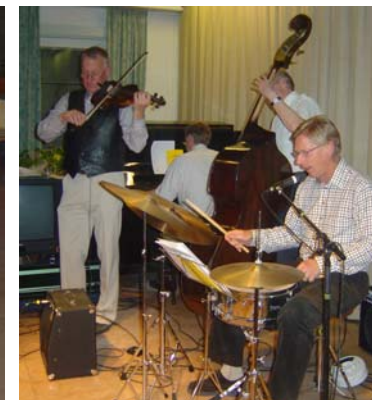
Stickan och co