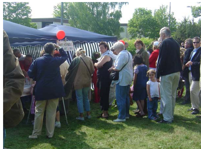
Det blir trängsel vid chokladhjulet, var så säker.