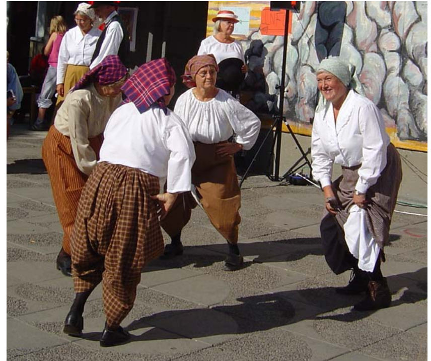
Tensta marknad 2003

Men glöm inte att dessa människor levde i ett helt annat samhälle än du. De arbetade ute och gjorde många rörelser som storstadsmänniskor aldrig gör. För dem var dansen det festliga ledet i en lång kedja av kroppsliga ansträngningar; för dig är kanske dansen ett av de få tillfällen då du rör dig i full fart, kanske t o m det enda.