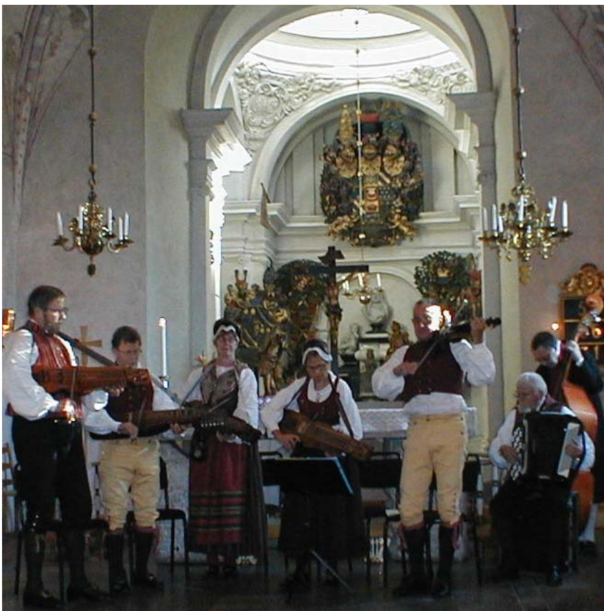
Spånga kyrka 2001

Folkmusikgruppen Trätakt visade sig vara den idealiska förstärkningen. Inte enbart därför att dom kan spela all slags musik utan framför allt för deras stora spelglädje, som stämde så bra med vårt motto, dansglädje.