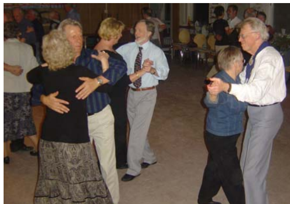
Full fart på dansgolvet

Musiken är som alltid outstanding. Hur många gillen kan glädja sig åt så många bra musiker som vi ständigt begåvas med? De kan precis allt!!! Vi var flera som bestämde att Stickans fiol är något av det bästa välljud man kan avnjuta.