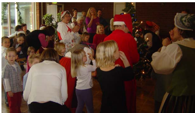
Hur är det nu elefanternas snabel ser ut?