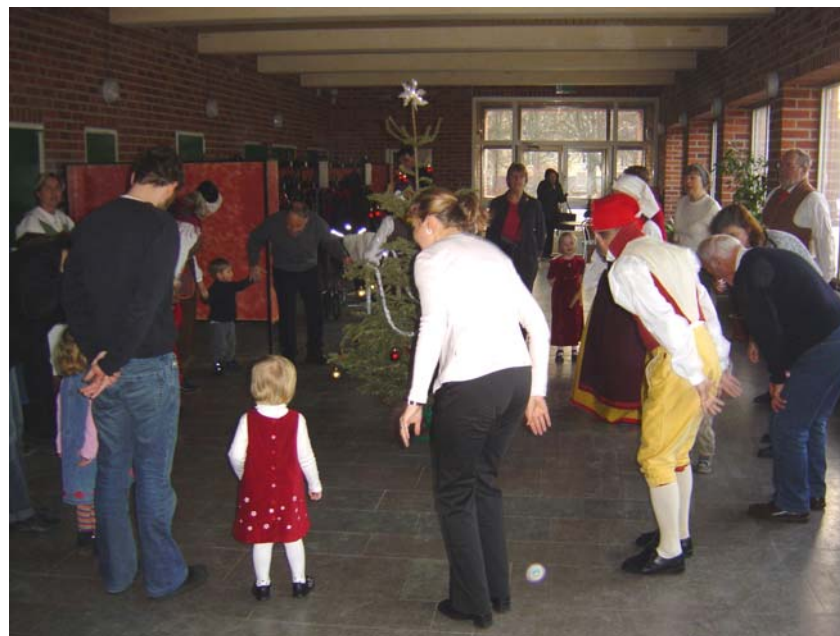
Räcksta Trädgårdsförening 22/1