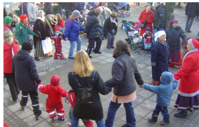
Några trotsade det begynnande vintermörkret och deltog i dansen